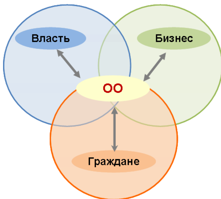
Рисунок 1. Поля активности основных стейкхолдеров гражданского сектора России

Прежде чем приступить к рассмотрению актуальных проблем развития ОО и гражданского участия, сделаем несколько базовых пояснений.