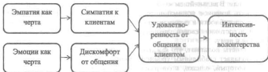
Рис. 3. Влияние эмоционального состояния и эмпатии на интенсивность волонтерской деятельности

менте Б. Сайма и С. Стермера [25; 26], в котором принимали участие немецкие студенты, занимавшиеся волонтерской деятельностью. Каждый из них «получал» партнера — иностранного студента, приехавшего учиться в Германию. Он должен был помочь иностранцу адаптироваться в новой среде: показать университет и город, познакомить с другими студентами. Некоторые иностранцы приехали из похожих на Германию стран — Великобритании, Швеции, США; другие — из стран, сильно отличающихся от Германии, например, Камеруна и Китая. Все волонтеры заполняли опросники, которые позволяли измерить аффективный компонент эмпатии к «своему» иностранцу (должны были отметить, в какой степени они испытывают по отношению к нему сочувствие, симпатию, интерес); а также его представление о партнере (степень привлекательности, достоинства доверия и т. д.). В конце исследования иностранные партнеры оценивали степень помощи со стороны волонтеров. Результаты исследования показали, что уровень эмпатии предсказывал помогающее поведение в парах, где иностранец был выходцем из похожей страны. В разнокультурных парах она зависела