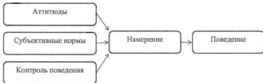
Рис. 1. Модель запланированного поведения

В-третьих, сила разных компонентов моделей определяется дополнительными факторами, среди которых индивидуальные особенности носителей аттитюдов, привлекательность и подобие людей, с которыми они собираются совершить действие, и т. д. Например, некоторые исследования показывают, что намерения участвовать в волонтерской деятельности предсказывают три фактора: аттитюды, субъективные нормы и контроль поведения. Однако воздействие аттитюдов опосредуется ощущением морального обязательства перед другими людьми: аттитюды оказывают большее влияние на намерения волонтеров, считающих, что участие в волонтерской ак-