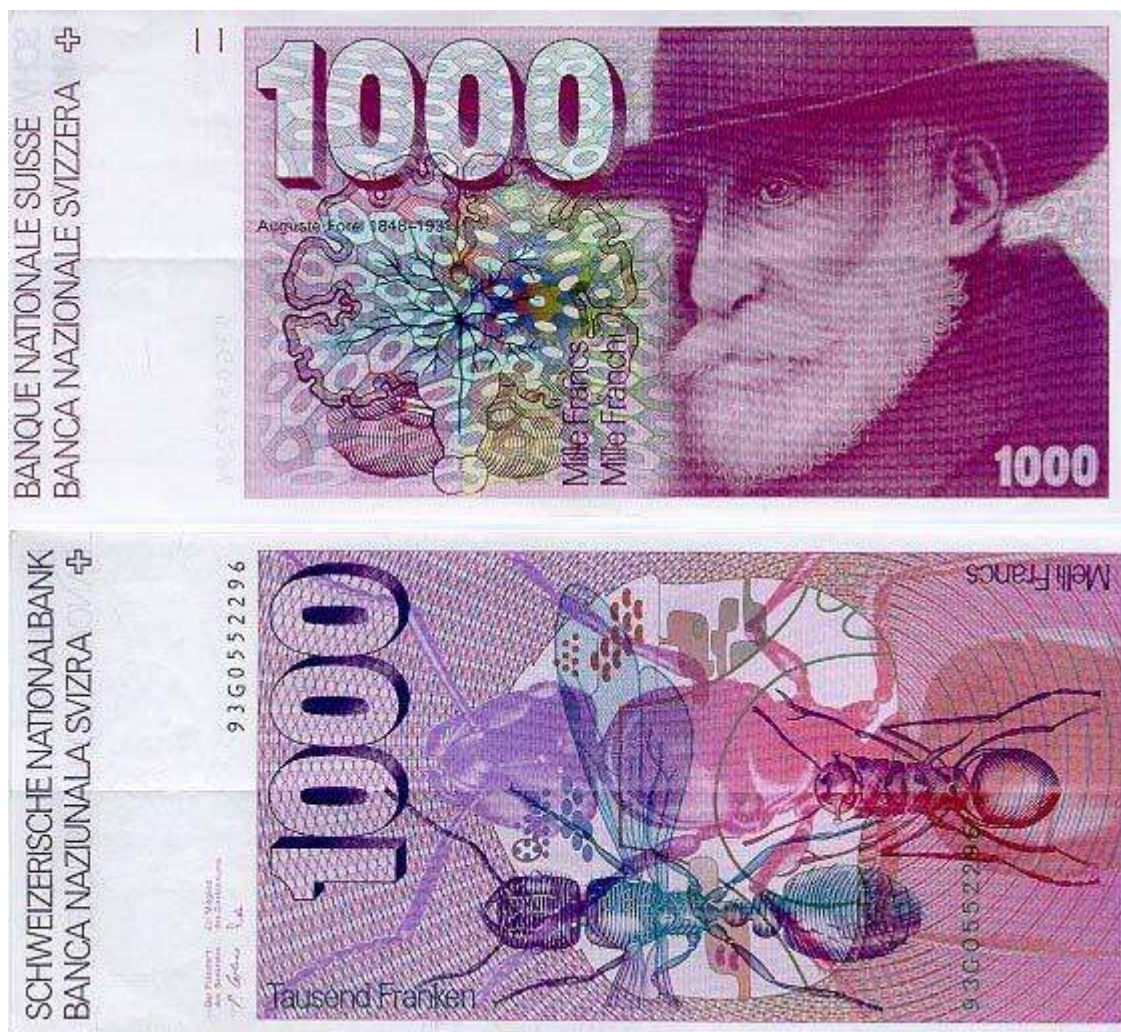
Рис. 8. Швейцария. 1000 франков 1978.

4 апреля 1978 г. Национальный банк Швейцарии выпустил в обращение банкноту номиналом 1000 франков с изображением Огюста Фореля с одной стороны и муравьями с другой (Рис. 8).