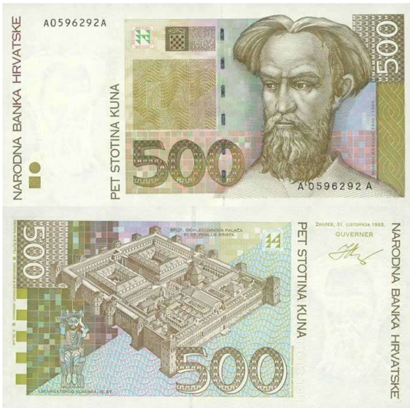
Рис. 1. Хорватия. 500 кун 1993.

Банкнота отпечатана типографией "Giesecke & Devrient" в Мюнхене. Цветовая гамма: оливковый. Размер купюры: 146x73 миллиметров.