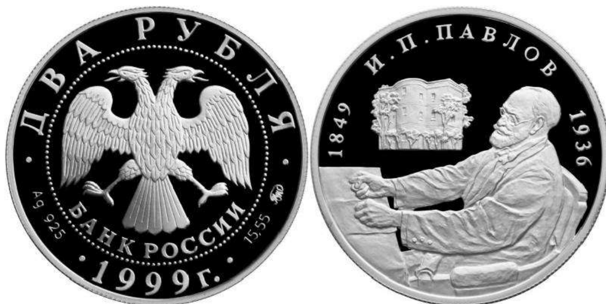
Рис. 13. Россия 2 рубля 1999.