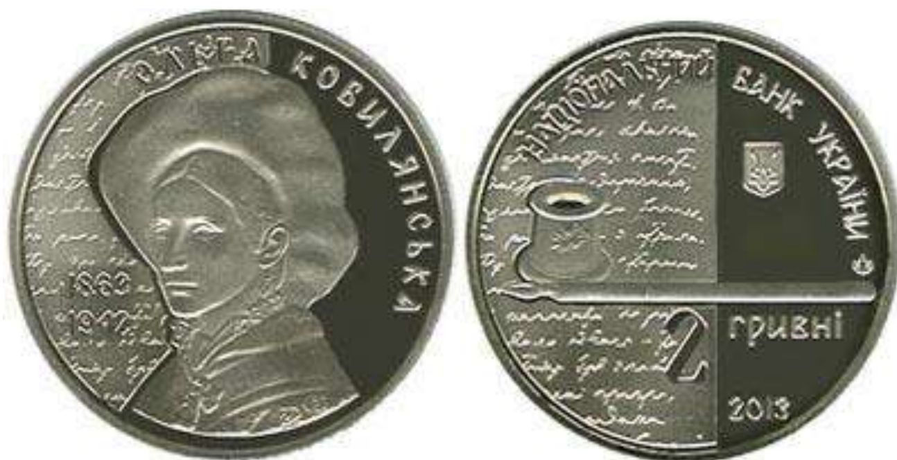
Рис. 11. Украина 2 гривны 2013.