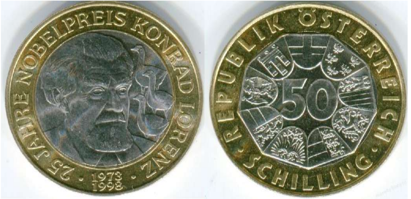
Рис. 6. Австрия. 50 шиллингов 1998.