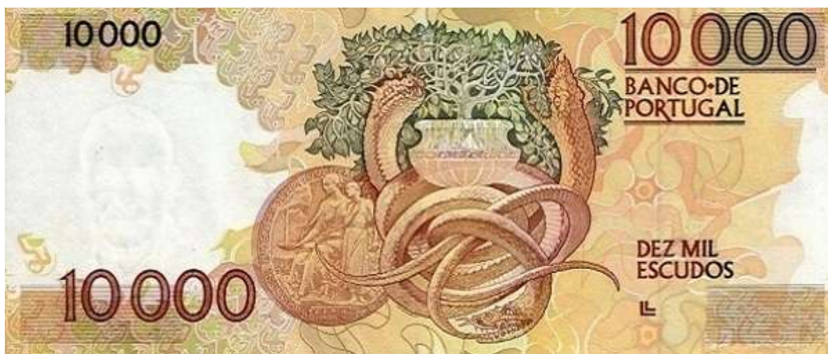
Рис. 10.. Португалия. 10000 эскудо 1989.