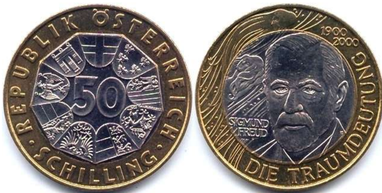
Рис. 2. Австрия. 50 шиллингов 2000

встретить дважды. В 2000 г. в Австрии была выпущена памятная монета посвященная 100-летию «Толкования сновидений». Монета носит номинал 50 шиллингов, на ней изображён портрет Зигмунда Фрейда (Рис. 2-3).