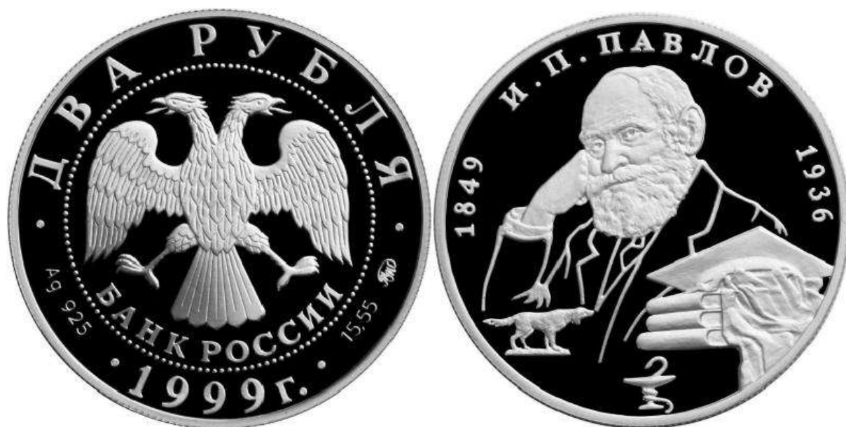
Рис. 12. Россия 2 рубля 1999.

Две серебряные монеты номиналом 2 рубля была выпущена Московским монетным двором в 1999 году, в рамках серии “Выдающиеся личности России” (Рис. 12-13). Выпуск монет был приурочен к 150-летию со дня рождения учёного. Они были отчеканены из серебра 925 пробы, 17 г каждая, диаметр монеты составляет 33 мм. Художник - А.А.Колодкин, скульптор - В.М.Харламов. Тираж каждой из монет - 15 тысяч экземпляров.