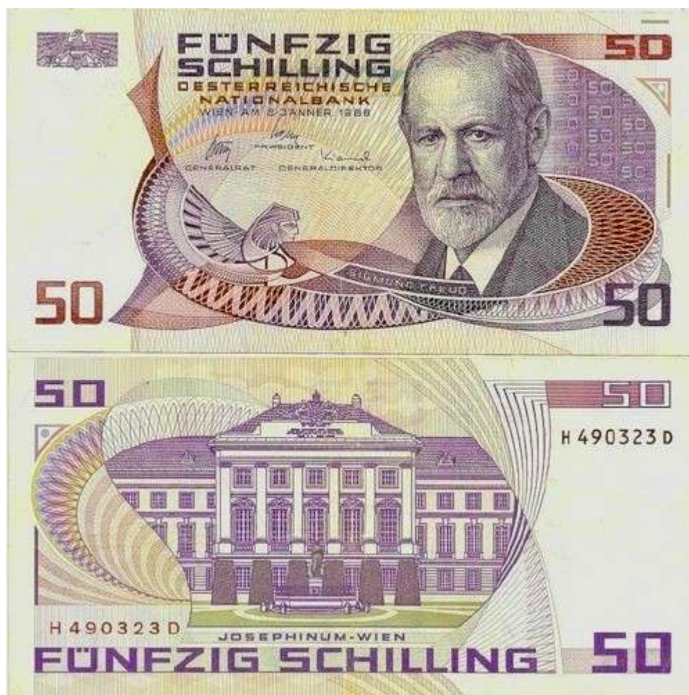
Рис. 4. Австрия. 50 шиллингов 1988.

номинал 50 шиллингов, Цвета: пурпурный и фиолетовый на многоцветном фоне. Размер 130x65 мм. Аверс: портрет знаменитого австрийского психолога и психиатра Зигмунда Фрейда. Реверс: дворец Джозефинум в Вене (Рис. 4).