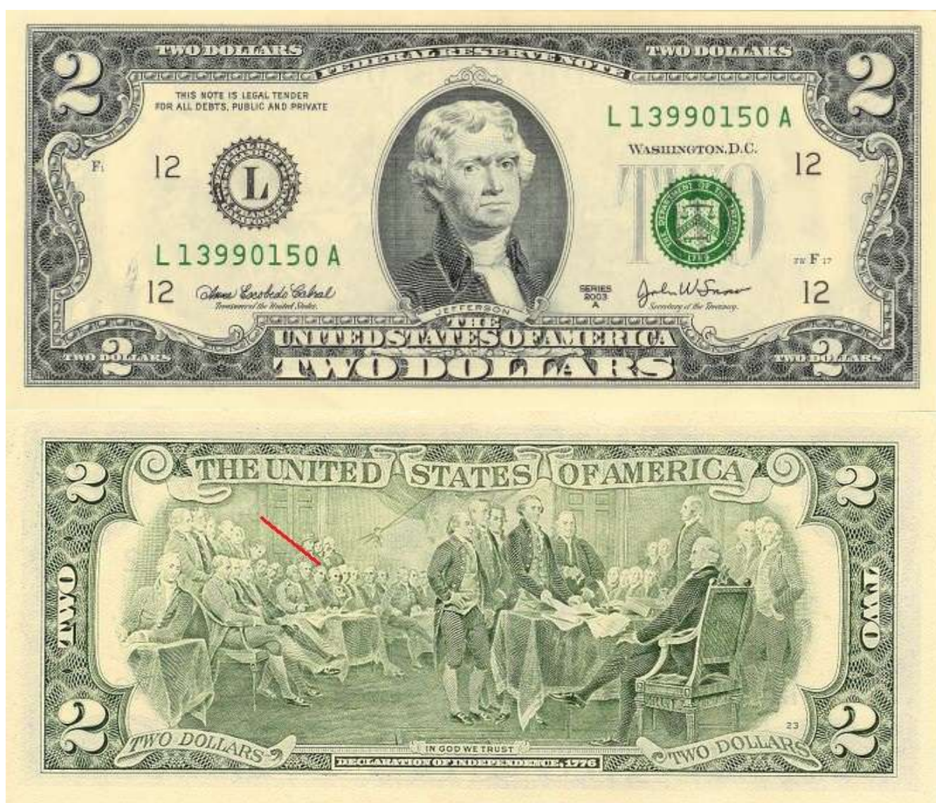
Рис. 9. Соединённые Штаты Америки. 2 доллара 1976.

Изображение Бенджамина Раша появилось вместе с другими деятелями американской борьбы за независимость на оборотной стороне банкноты в 2 доллара, где изображена репродукция картины Джона Трамбулла «Декларация независимости» (Рис. 9). Данная банкнота была выпущена в 1976 году к празднованию 200-летия независимости США.