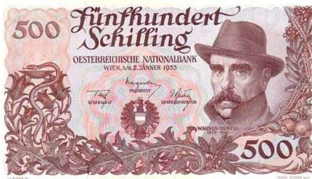
Рис. 5. Австрия. 500 шиллингов 1953.