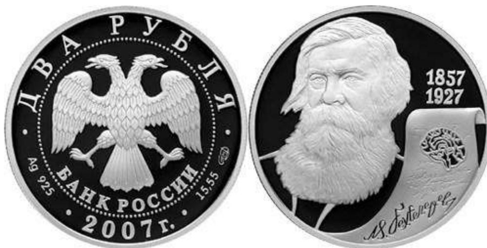
Рис. 14. Россия 2 рубля 2007.

Подобный выбор для России вероятно связан с господствовавшей на протяжении периода Советской власти научной парадигмы. По всей видимости использование тех же образов вероятно связано с укоренённостью этих образов в мышлении.