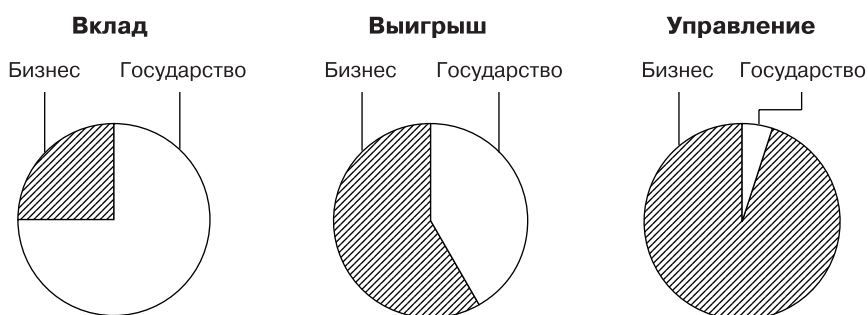
Рис. 1. Распределение вкладов, выигрыша и управленческих функций в успешных проектах государственного участия в финансировании частных инновационных проектов

Однако нельзя недооценивать и риски: государство по старинке может захотеть вмешаться в бизнес больше, чем тот полагает приемлемым, и потребовать в обмен на ресурсы права принятия решений в области оперативного управления и политики в отношении акций и акционеров. Как правило, государство в успешных проектах уменьшило свои притязания на собственность и участие в управлении, тем самым разрешив конфликтную ситуацию (см. рис. 1). В роли арбитра и получателя социальных и политических бонусов государство оказалось в таких проектах более успешным, чем в роли рулевого и предпринимателя.