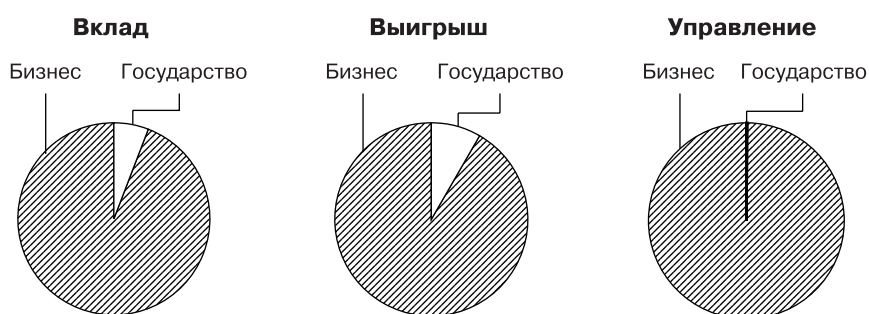
Рис. 3. Соотношение вклада, выигрыша и управления в третьем типе проектов частно-государственного взаимодействия

тантом (при сохранении права вето у кредитного института) и отличалась высокой прозрачностью и дисциплиной построенного бизнеса (рис. 3).