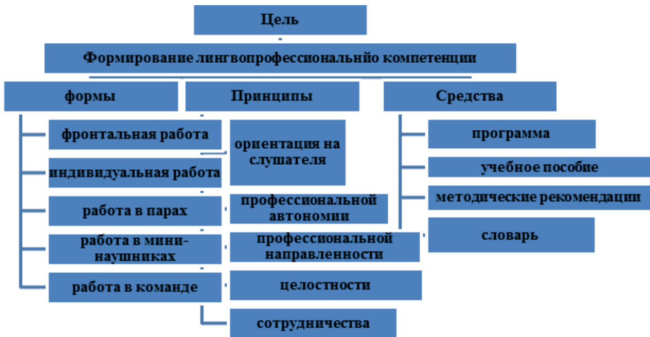
Рис. 1. Модель формирования лингвопрофессиональной компетенции у будущих специалистов

Важными составными частями процесса интенсивного формирования у студентов коммуникативных навыков и умений являются автоматизация речи обучающихся, переход на произносительный контур иностранного языка, организация «погружения» в речевую среду, запоминания, рецептивного и продуктивного воспроизведения лексико-грамматических структур, моделей монологической и диалогической форм деловой речи.