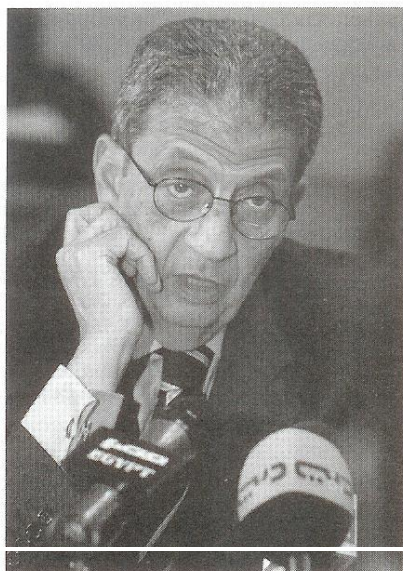
Генеральный секретарь ЛАГ Амр Муса выступил с инициативой создания Арабской «соседской» зоны, подразумевающей установление более тесных отношений Лиги с Ираном и Турцией.

Основной тезис Мусы сводился к разрешению палестино-изра-