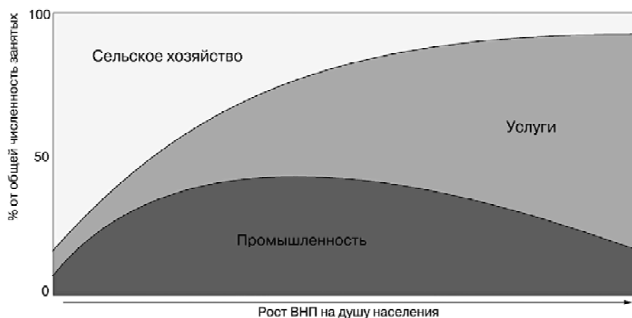
Рис. 2. Изменение структуры занятости населения по мере экономического развития страны

стриализация не отменила и не девальвовала значимость сельского хозяйства в экономике стран.