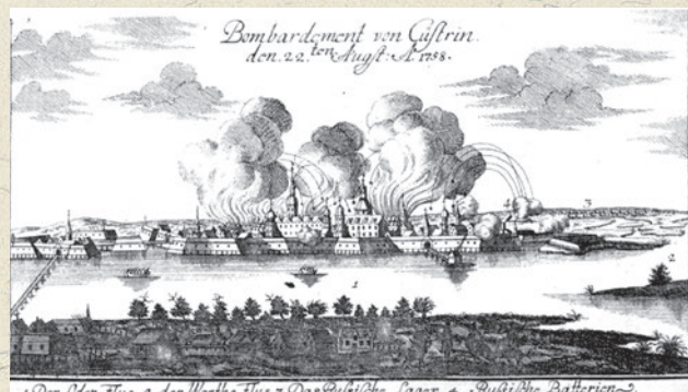
▲ Бомбардировка крепости Кюстрин русскими войсками. Гравюра, 1759 г.

Немаловажно также, что крепость Кюстрин на реке Одер (современный городок Костшин-над-Одрой в Польше) была почти полностью разрушена, но так и не взята русскими войсками, и изображения её осады и штурма едва ли должны были вдохновлять русских гравёров, в то время как для против-