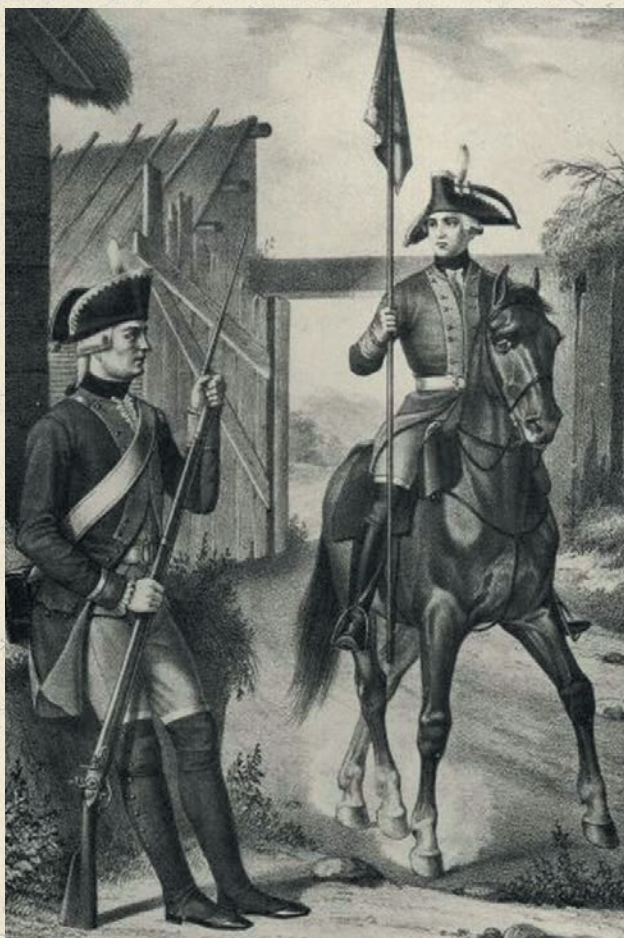
▲ Капрал и фурьер Мушкетёрских рот Пехотного полка, с 1763 по 1786 г. Литография. 1841 г.

В отличие от сказки документ безжалостен и бесстрастно рассказывает о болезнях и увечьях списанных служивых. Выбитые суставы, чахотка, недостающие «персты», грыжи, старые раны, плохое зрение, слабость в ногах – далеко не полный перечень причин увольнения со службы, а перечисленные – ещё далеко не самые страшные. Один «скорбен животом», другой не владеет правой