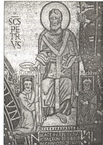
Рис. 2. Св. Петр (в паллии) передает паллий папе Льву III. Мозаика. Конец VIII в. Фрагмент. Рим.

в силу своей должности носили омофоры, и паллий папы стал не чем иным, как западным аналогом омофора 19 . Хотя предположение о происхождении омофора от императорского лора и высказывалось в литературе, но без каких бы то ни было доказательств 20 , так что давнее мнение о независимом развитии трабеи-лора и омофора выглядит куда предпочтительнее 21 .