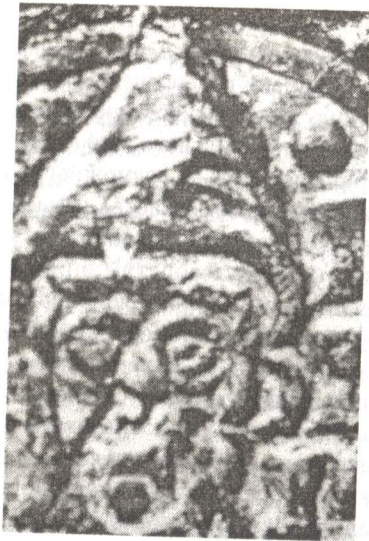
Рис. 6. Монета папы Сергия III (904 – 911). Фрагмент.

ру» 69 (Рис. 9–10). Наконец, мы видим первый несомненный фригий, но только таким, как его представлял себе заказчик росписи в середине XIII в., а не изготовитель фальшивки VIII или IX в. 70 В любом случае сравнить этот папский головной убор с императорской митрой возмож-