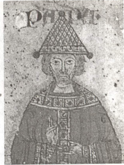
Рис. 8. Композиция «Власть духовная». Свиток Exultet из Монтекассино. Ок. 1087 г. Фрагмент.

ности нет, поскольку сколько-нибудь достоверного ее изображения не обнаружено. Правдоподобнее всего выглядит, пожалуй, продолговатая, вытянутая вверх, «корона» на голове короля Танкреда в интерпретации сицилийского миниатюриста, иллюминировавшего в 1195–1197 гг. стихотворную «Книгу к чести императора» ( Liber ad honorem Augusti ) Петра из Эбуло 71 (Рис. 11). Однако надежным это свидетельство считать нельзя уже потому, что мы имеем здесь дело со своего рода политической карикатурой, где художник мог дать полную волю фантазии. Когда же, например, Ж. Дагрон предлагает увидеть митру-туфу-тогу на знаменитом «плате Гунтера» из Бамбергского епархиального музея, датированном примерно серединой XI в., он явно заблуждается 72 . На головах обеих дев, подносящих дары (шлемы) императору, вовсе не тиары, а упрощенные венцы в форме городских стен — типичный атрибут тех женских фигур,