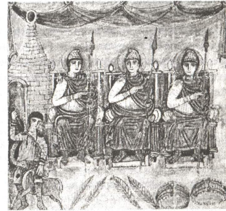
Рис. 5. Эней, Акест и Элим приносят жертву Анхизу. Миниатюра из т.н. Римского Вергилия. Конец V в.