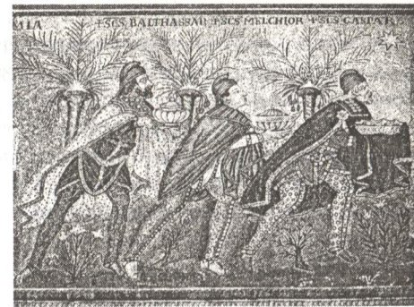
Рис. 4. Три царя (волхва) Мозаика. Начало VI в. Равенна. Сант-Аполлинаре Нуово.