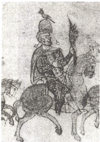
Рис. 11. Самозванец Танкред с тиарой на голове. Конец XII в. Миниатюра.

Главный недостаток таких объяснений состоит, думается, в том, что в их основе лежат неверные представления о кругозоре и складе мышления авторов такого рода документов. Любые фальшивки составлялись не ради доказательства абстрактных политико-богословских тезисов, а для достижения предельно конкретных и, как правило, сугубо приземленных целей. И такие цели «Константинова Дара» неплохо просматриваются в самом его тексте. Распоряжение Константина должно сохранять свою силу «вплоть до конца мира» и связывать тем самым «перед лицом Бога Живого... и ужасного Его суда» «всех наших преемников-императоров, всех оптиматов и начальников провинций», а также сенат и народ «по всему кругу земель» обязательством не менять ничего в привилегиях, предоставленных