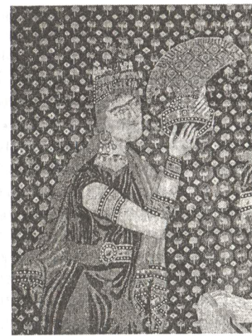
Рис. 11. Дева, подносящая дар императору. Сер. XI в. Вышивка. Фрагмент.