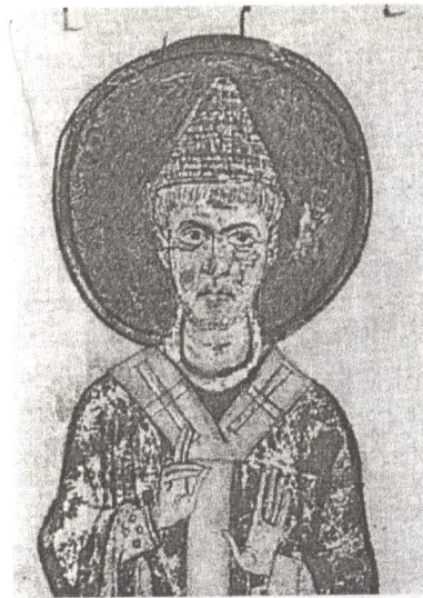
Рис. 7. Композиция «Власть духовная». Свиток Exultet из Бари. Ок. 1026 г. Фрагмент.

временем около 1087 г. 68 (Рис. 8). По поводу цвета шапки можно спорить: в первом случае назвать ее белой сложнее, чем во втором, где, учитывая условность используемых в Exultet цветов, ее, кажется, допустимо считать скорее белой, чем красной. Похоже, что и на монете, и на всех других ранних изображениях художники с самого начала подразумевали, что шапка папы сделана не из металла или иного твердого материала, а из какого-то текстиля. Каким словом называли сами художники эту шапку — камелавкием, фригием, регнумом или короной — остается только догадываться. И только знаменитые фрески капеллы св. Сильвестра в римском храме Четырех коронованных святых мучеников не оставляют на сей счет никаких сомнений, поскольку они служили иллюстрациями к «Константинову Да-