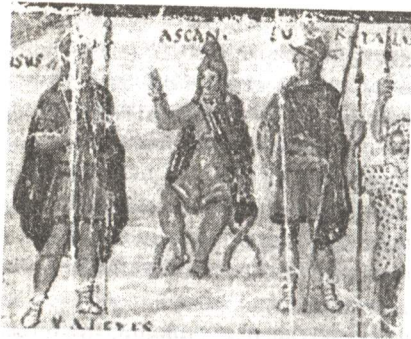
Рис. 3. Асканий на совете. Миниатюра из т.н. Ватиканского Вергилия. Рубеж IV и V вв. Фрагмент.