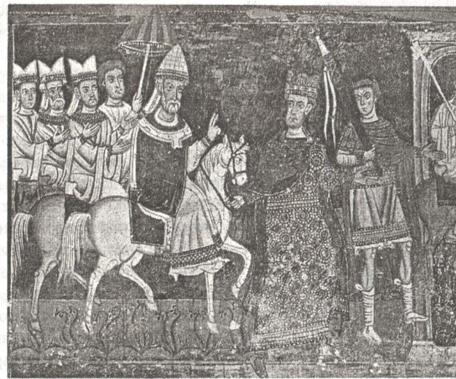
Рис. 10. Император Константин ведет коня папы Сильвестра. Сер. XIII в. Фреска. Рим. Санти Кватро Коронати.