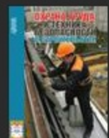
Охрана труда и техн