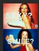
Online Converse shoes