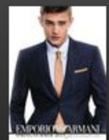
Emporio Armani - Men