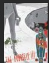
Лонгборды Globe Online каталог лонгбордов Globe c