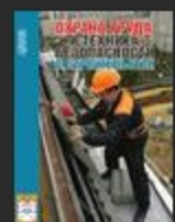
Охрана труда и техн