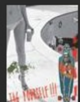
Лонгборды Globe Online каталог лонгбордов Globe c