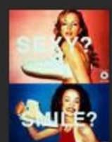
Online Converse shoes