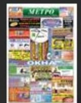
Meleys № 3 (36)