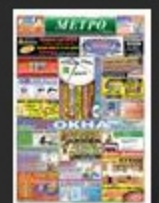
Meleys № 3 (36)