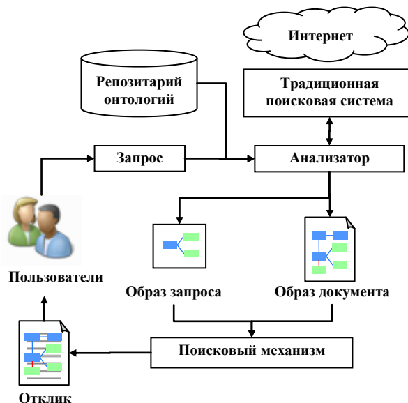
Рисунок 2 – Общая схема работы поисковой системы

Основная особенность предлагаемого подхода – использование репозитория онтологий на этапах преобразования запроса и документа. Откликом является структурированный документ, т.е. документ, в котором выделены понятия онтологий.