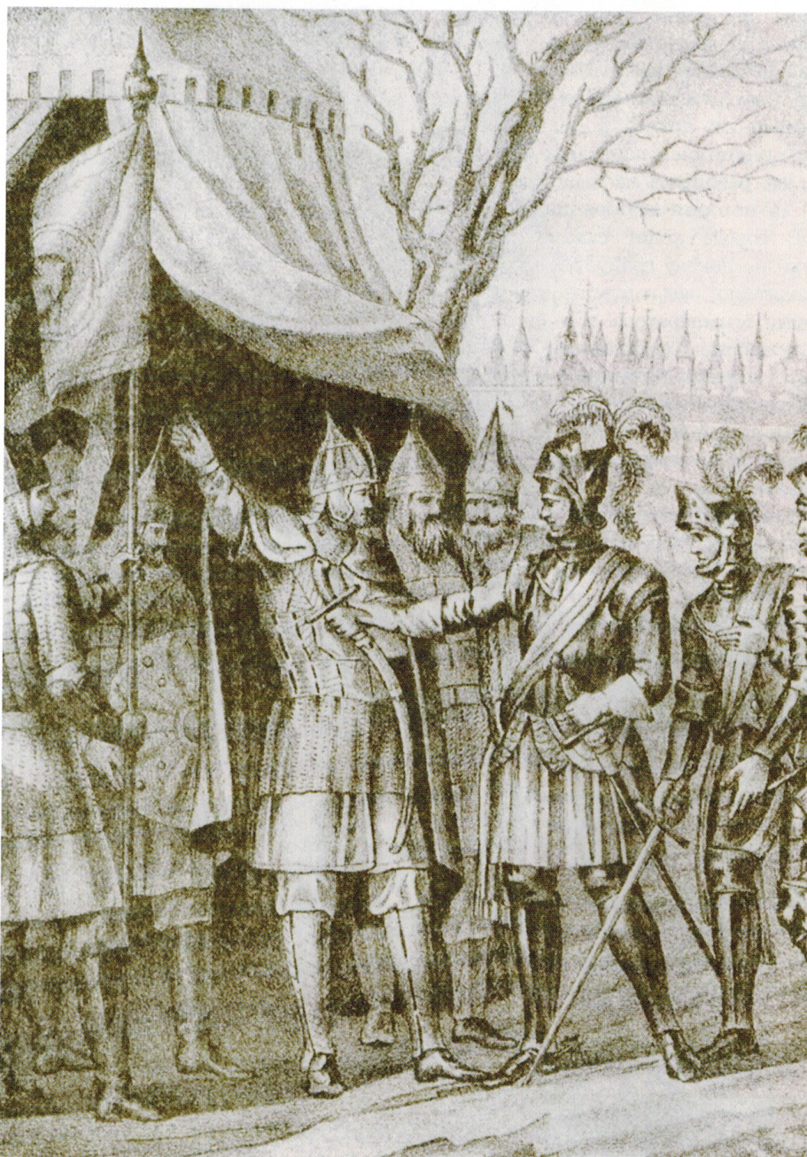
Свидание князя Михаила Скопина-Шуйского со шведским полководцем Делагарди. Иллюстрация к изданию «Живописный Карамзин, или Русская история в картинах». Худ. Б.А. Чориков

Впрочем, близость к Швеции, постоянное присутствие в городе шведских торговцев, гонцов, а иногда и дипломатов высокого уровня, заметный интерес к Новгороду со стороны шведских политиков накладывали свой отпечаток на жизнь города. То, что сегодня назвали бы «трансгра-