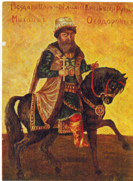
Царь Михаил Федорович Романов