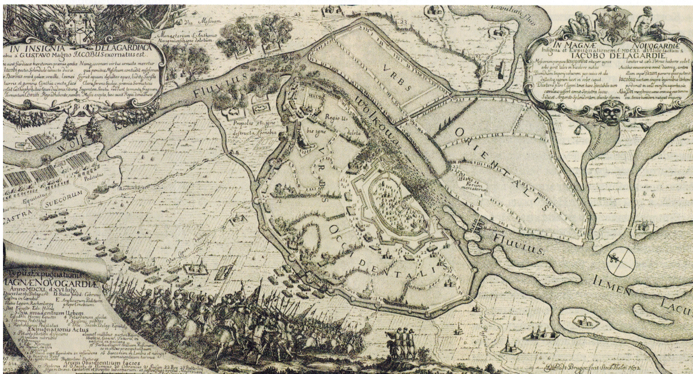
План осады Новгорода Якобом Деллагарди в 1611 году

Между тем шведы постепенно юдили в Новгороде и Новгородой земле новые порядки. Этот реим далеко не во всем повторял