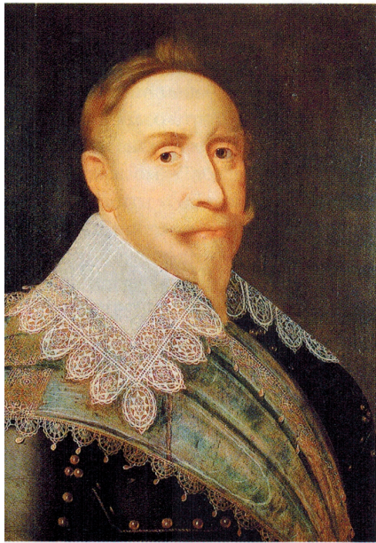
шведский король Густав Адольф