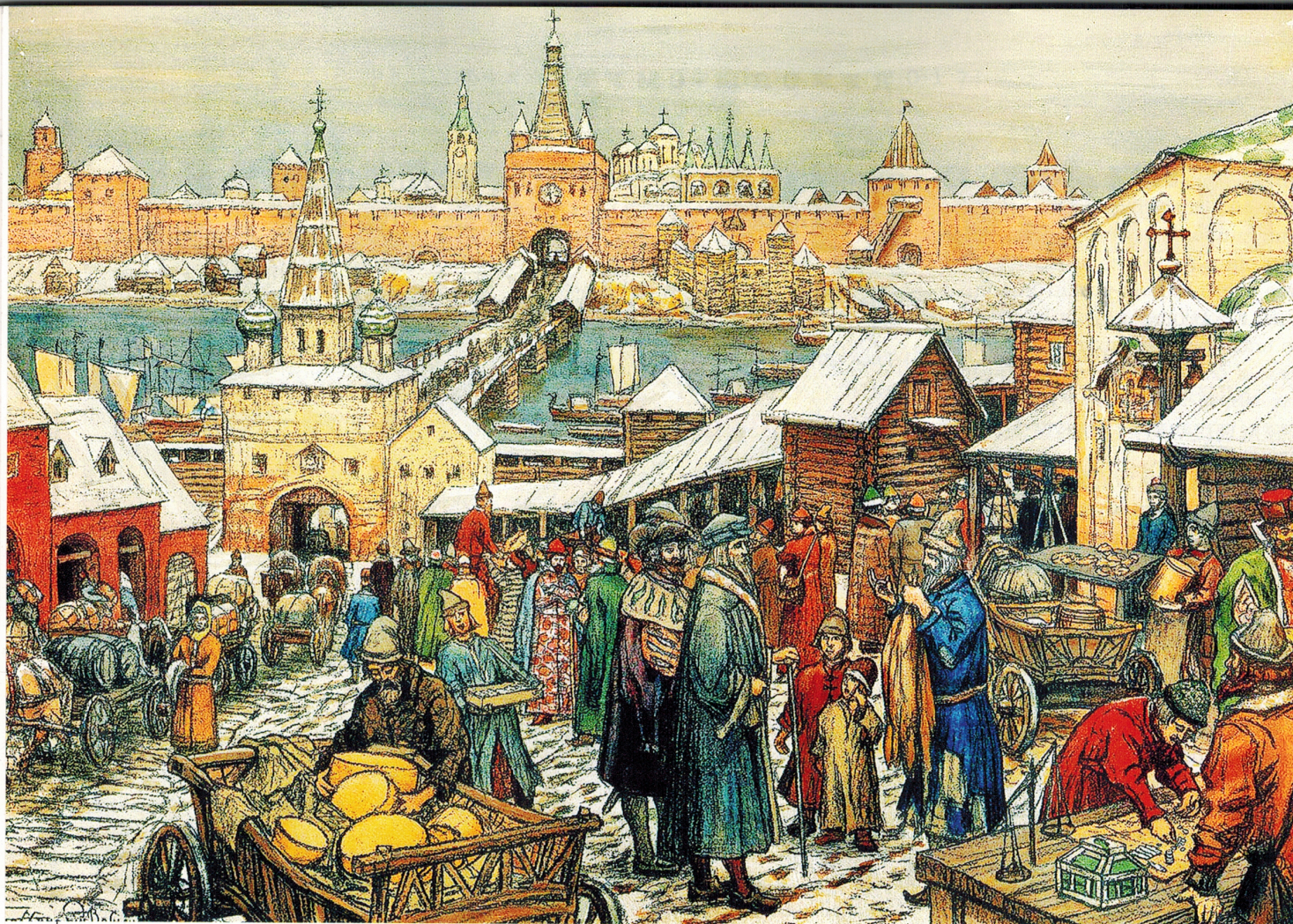
Новгородский торг. Худ. А.М. Васнецов. 1909

Несмотря на военные успехи, русско-шведский союз был под постоянной угрозой разрыва. Делагарди требовал от Василия Шуйского подтверждения договора о передаче Корелы, который годом ранее подписал Скопин-Шуйский. Царь подтвердил согласие на территориальные уступки.