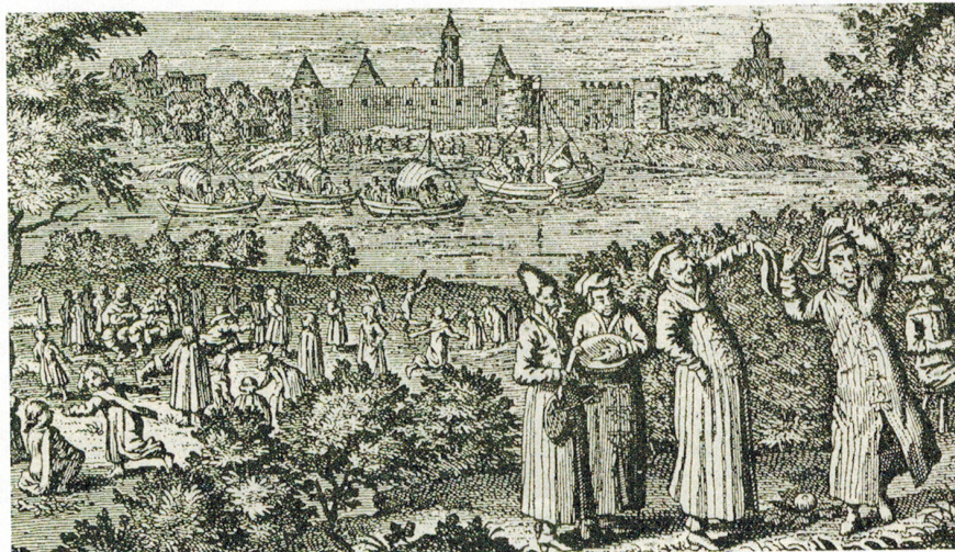
Город Ладога. Гравюра из книги А. Оллария «Описание путешествия в Московию». 1630–1640-е годы