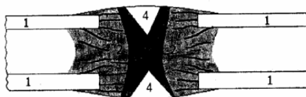
Рис. 2. Схема строения костного регенерата 1 – материнская кость, 2 – новообразованная костная ткань, 3 – неотвердевшая область регенерата, в которой происходят рост и деление клеток, 4 – островки хряща

Важной составляющей регенерации является отложение кальция между волокнами внеклеточного матрикса, приводящее к его отвердеванию и управляемое, в частности, клеточной активностью [16]. Источником поступления кальция является сеть кровеносных сосудов, прорастающих со стороны костных отделов регенерата в сторону его центральной части. При благоприятных условиях в течение длительного времени сохраняется зона роста, из которой постоянно исключаются подвергшиеся оксификации (окостенению) перифериче-