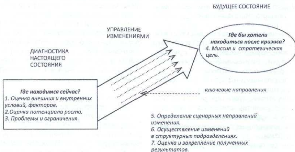
Рис. 2. Управление процессом изменений по ключевым направлениям развития

Сценарий А. «Продолжающийся рост» предполагает, что государство, несмотря на кризисные явления, которые идут на спад, будет на прием-