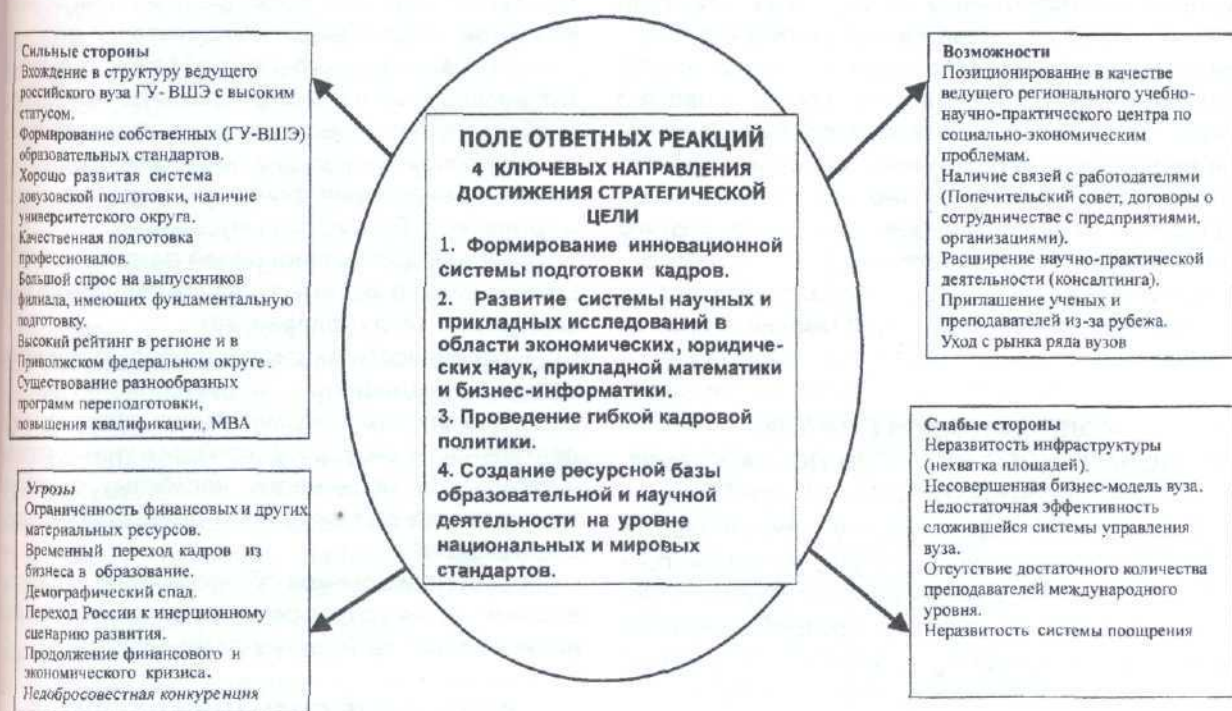
Рис. 1. Проектное поле ответных реакций ФФ ГУ-ВШЭ в условиях кризисных явлений

зация образовательного процесса, исследований и разработок через активное привлечение ведущих иностранных исследователей, молодых профессоров, студентов и аспирантов; импорт передовых образовательных программ и технологий; создание и внедрение собственных образовательных инноваций. Развитие подобной системы позволяет снизить остроту влияния демографической ситуации, повышает конкурентоспособность филиала и дает возможность длительного получения качественного образовательного продукта на период до 2020 г.