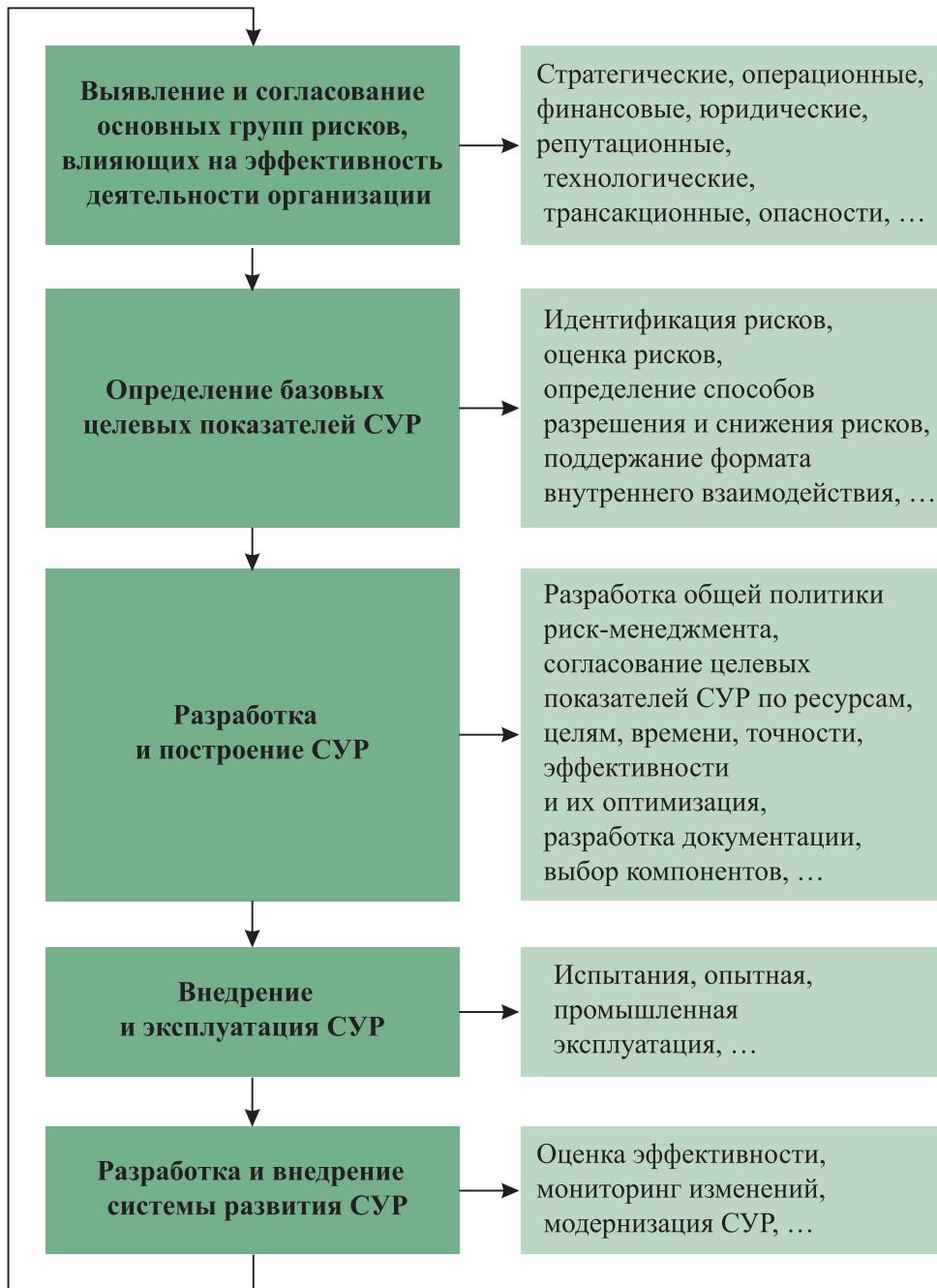
Рис. 2. Схема универсального алгоритма внедрения СУР

Совпадение интересов бизнеса и государства в вопросах повышения качества и снижения затрат ресурсов на формирование и применение универсальных подходов к построению СУР явилось основой разработки моделей, принципов и стандартов по управлению рисками, исходя из опыта лучших мировых практик. Наиболее распространёнными стандартами интегрированных систем управления рисками на сегодня стали FERMA, COSO ERM и ISO 31000:2009.