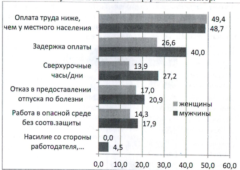
Рис.2. Виды эксплуатации, которым подвергались таджикские трудящиеся мигранты в принимающих странах, ОРС-2009, в %

При этом по всем трудовым правам, оговариваемым в трудовом договоре, позиции мужчин-мигрантов были значительно хуже, чем позиции женщин, что отчасти объясняется отраслевой структурой занятости и различной степенью вовлеченности мужчин и женщин в неформальный сектор.