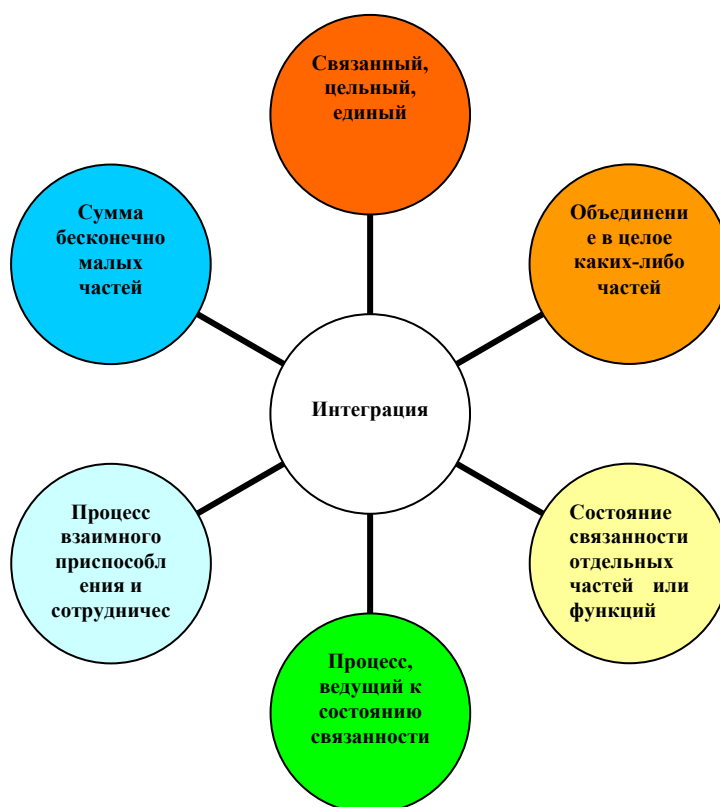
Рисунок 2. Общие значения термина «интеграция».

При понимании интеграции как процесса: объединение, связывание, сближение, приспособление, сотрудничество, единение, сплочение.