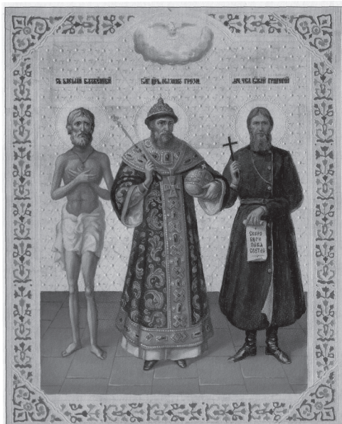
«Икона» «Святой Василий Блаженный, благоверный Царь Иоанн Грозный и мученик Григорий». В.Г.Цветков, Новый друг . (Нижний Новгород, 2004). Вкладка между страницами: 42-43.