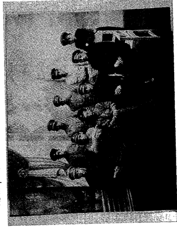
הכינוס הראשון של 'ז'יילי הצבא האדום הבונדיסטים', סמולנסק, 20-23 במרס 1920.