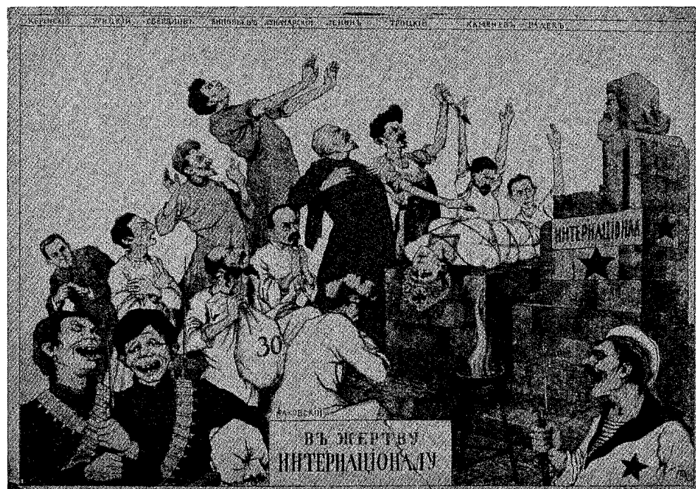
'הקרבה למען האינטרנציונל'. כרוזה של לשכת הידיעות של צבא המתנדבים (ОСВАГ). טוד עליין (משמאל לימין): אלכסנדר פ' קרנסקי, משה אוריזקי, יעקב מ' סברדלוב, גריגורי י' זינובייב, ולדימיר א' לנין, לב ד' טרוצקי, לב ב' קמנב, קרל ב' ראדק. טוד אמצעי (מימין לשמאל): כריסטיאן ג' רקובסקי, אנטולי ו' לונצ'רסקי.