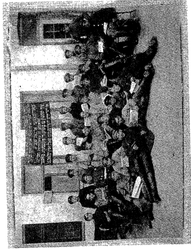
תצלום קבוצתי של ארגון 'בונד' בעיר גומל. גומל, 10 במאי 1919.

אולם השלטון הסובייטי, בניגוד למשטר הלבן, נלחם באמת ובאופן שיטתי במוגרומים. הוא לא נזקק ולא התכוון בשום פנים ואופן להשתמש באנטישמיות בתור דגל אידאולוגי, שכן היו לו מספיק סממנים מושכות המונים שאותן לא יכלו לנצל חלבים. בי 25 ביולי 1918 (פורסם ב-27 ביולי 1918) הוציאה מועצת הקומיסרים העממיים של ר.ס.פ.ר. (הרפובליקה הרוסית הסובייטית הפדרטיבית) 'צו על מאבק באנטישמיות ובפוגרומים יהודיים', ובו הכריזה, כי 'התנועה האנטישמית והפרעות ביהודים הם אבדה לעניין המהפכה הפועלית והאזרחית', וקראה ל'עם העמל של רוסיה חסוציאליסטית להילחם ברוע הזה בכל האמצעים'. על כן, הורתה הממשלה הסובייטית לכל מועצות הצירים (Совдены) לנקוט אמצעים תקיפים כדי לעקור מן השורש את התנועה האנטישמית. [על כן,] אנו מודים להעמיד פורעים ומנהלי תעמולת פיועות מחוץ לחוק. 93 כמה מאות מחוללי פוגרומים נאסרו, התיקים שלהם נבחנו בישיבה מחוץ לגניזין של בית דין שדה מיוחד מטעם חיל הפרשים הראשון, שישב ב'רלתיים' פתוחות באוקטובר 1920 ביילסווסטר. על פי נתונים שונים, נידונו למוות והוצאו להורג לאלתר בין 200 ל-400 איש. ההיפרעות חסרת הרחמים ממחוללי הפוגרומים התבררה כאמצעי יעיל, וחלה ידיה תללה במספר מבצעי הפוגרומים בקרב הצבא האדום. לרוב היהודים לא היו סיבות מספיקות לאחזב את הבלשביקים, שהרסו את יסודות קיומם הכלכלי בכרכיים על המסחר והיוזמות כעל מפעלים התכוונו בין השאר לחסל גם את 'רעיות הקוזמות החתיות' שלהם. אולם הבחירה בין האזרחים ללכנים הייתה בחורגה בעבור היהודים לבחירה בין החיים ובין המוות. לא מפלא אפוא שהם נבחרו בחיים.