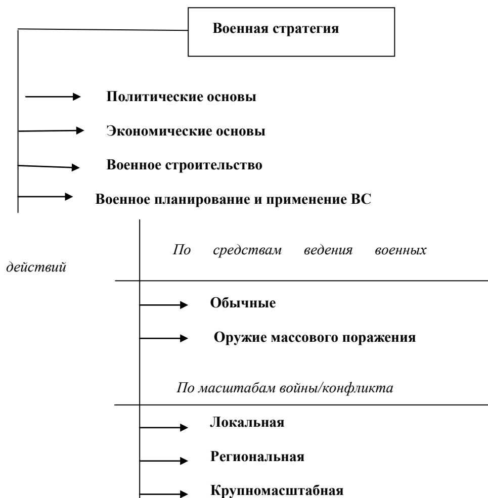
Схема 2. Декомпозиция понятия «военная стратегия»