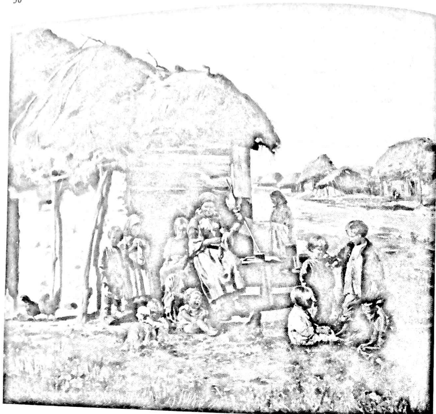
В.Маковский. Крестьянские дети. 1890

Однозначно оценить состояние современной российской историографии экономического развития пред- и пореформенной деревни непросто. Прежде всего, можно констатировать, что с открытием архивов и ощутимой децентрализацией науки внимание исследователей явно сдвинулось в сторону истории послереволюционной эпохи и региональных процессов. На мой взгляд, время «собирать камни» здесь еще не настало, что отчетливо проявляется в небольшом количестве обобщающих работ и новых гипотез 25 . Дело еще и в том, что аграрная проблематика очень «консервативна»: глубокое проникновение в тему требует долгих лет работы и отнюдь не гарантирует «революционных» открытий.