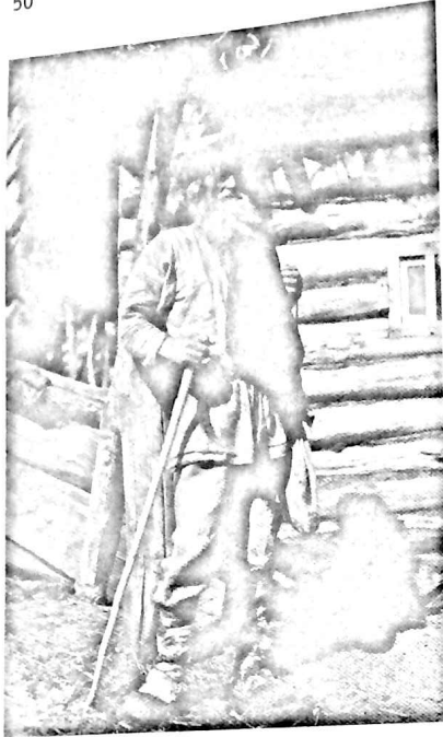
Русский крестьянин, последняя четверть XIX в.

1. Абсолютное и относительное сокращение численности крепостных во второй четверти XIX в. не имело никакого отношения к их «вымиранию», а объяснялось совокупностью нескольких внеэкономических причин: массовым выкупом крепостных казной и удельным ведомством, а также рекрутскими наборами, изымавшими из крепостного состояния не только рекрутов, но и их потомство 7 .