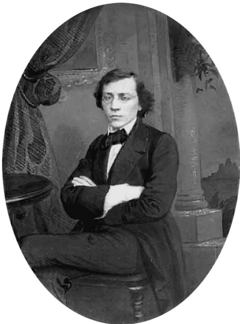
Первый фотопортрет Н.Г. Чернышевского. 1853

В. Кантор Почему Чернышевский не эмигрировал?