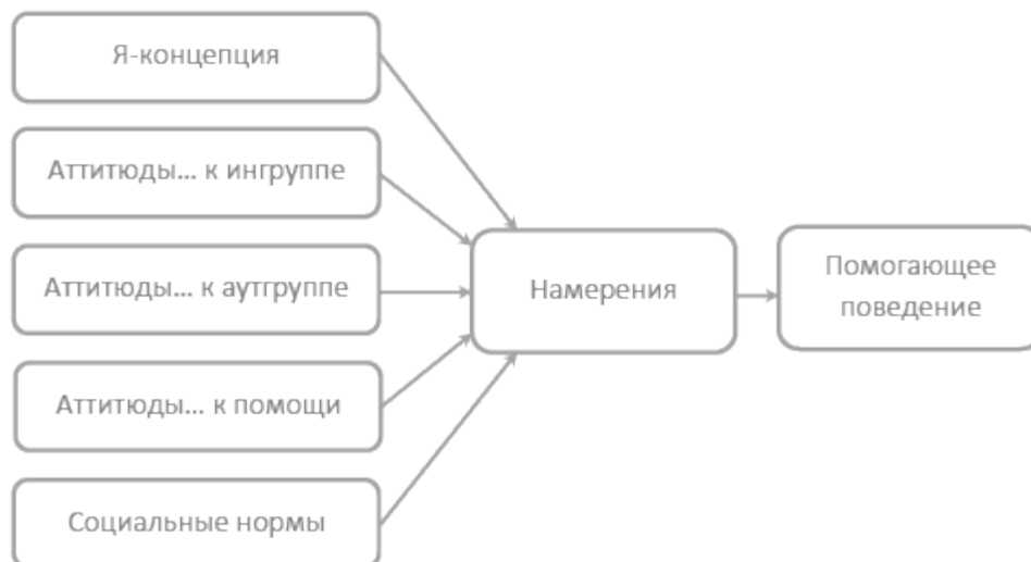
Рис. 1. Факторы помогающего поведения.

С некоторыми оговорками эти модели предсказывают индивидуальное поведение человека по отношению к самому себе (например, здоровый образ жизни). Чтобы использовать их для изучения социального взаимодействия, необходимо увеличить перечень факторов (рис. 1).