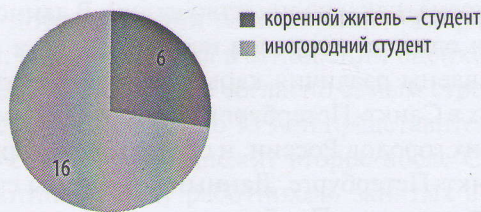
Рис. 1. Соотношение студентов — коренных жителей к иностранным

В оценке текущей предпринимательской деятельности и отношения к предпринимательству в целом был задан вопрос: «Задумывались ли вы серьезно о создании собственного бизнеса?». Мнения респондентов распределились следующим образом: 19 респондентов видят себя в роли креативных предпринимателей, из них 8 человек имеют серьезные намерения создать свое дело, другие 8 студентов иногда задумываются о создании, и 3 студента уже начинают собственное дело. Оставшиеся 3 студента вообще не рассматривают вариант построения своей карьеры через креативное предпринимательство (рис. 2).