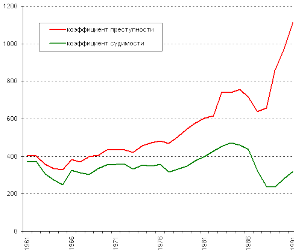
Диаграмма 4. Коэффициенты преступности и судимости в 1961-1991 годах (на 100 тыс. человек)

На наш взгляд, такой подход позволяет обнаружить слабое, уязвимое место юриспруденции и базирующейся на ней уголовной политики, подобно пятке Ахиллеса, и констатировать, что рекомендации последних, зачастую, имеют паллиативный характер, а законодательные инициативы, на этом направлении, импульсивно-спонтанны. Он произведен от основного вопроса социальной философии – вопроса о взаимосвязи людей и общества, являющегося определяющим для понимания всех основных социально-философских проблем правопорядка, в том числе и рассматриваемой нами взаимосвязи, соотношения преступности, судимости и призерности. В данном случае речь идет о людях «меченых» клеймом судимости (вариации их удельного веса в