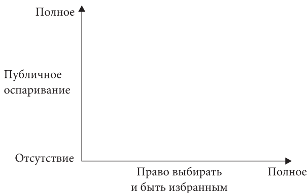
Рис. 1.1. Два теоретических измерения демократизации

Предположим далее, что мы рассматриваем процесс демократизации как состоящий по крайней мере из двух измерений: публичного оспаривания и права на участие (рис. 1.1). Несомненно, большинство читателей считает, что демократизация подразумевает и другие измерения. Вскоре я собираюсь обсудить третьи из них, но в данный момент предлагаю ограничиться лишь этими двумя. В контексте уже сказанного я считаю, что развитие системы публичного оспаривания не обязательно является эквивалентным полной демократизации.