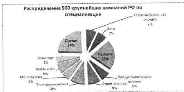
Рис. 1. Распределение крупнейших по объему выручки компаний Российской Федерации по специализации в 2010 г., % (на основании рейтинга РБК 500, журнал «Финанс»)

Ниже представлено более подробное распределение крупнейших компаний по объему выручки с учетом их специализации.