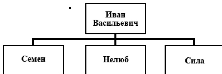
Рис. 2. Схема 1. Генеалогические связи И. В. Пушкина и сыновей

Другой клан Пушкиных, также относившийся к Водской пятине, – это потомки Булгака (Якова) Игнатьева сына Пушкина (схема 2). Этот сын боярский известен как помещик Сабельского погоста еще в 1578/79 г., совладелец братьев Курбата и Никиты 22 . К 1582 г. он вышел из службы и жил в поместье своего сына Ивана, вместе с невесткой Анной 23 . Я склонен предполагать, что И. Я. Пушкин был младшим сыном Булгака (Якова). Он стал помещиком Будковского погоста к 1578/79 г. 24