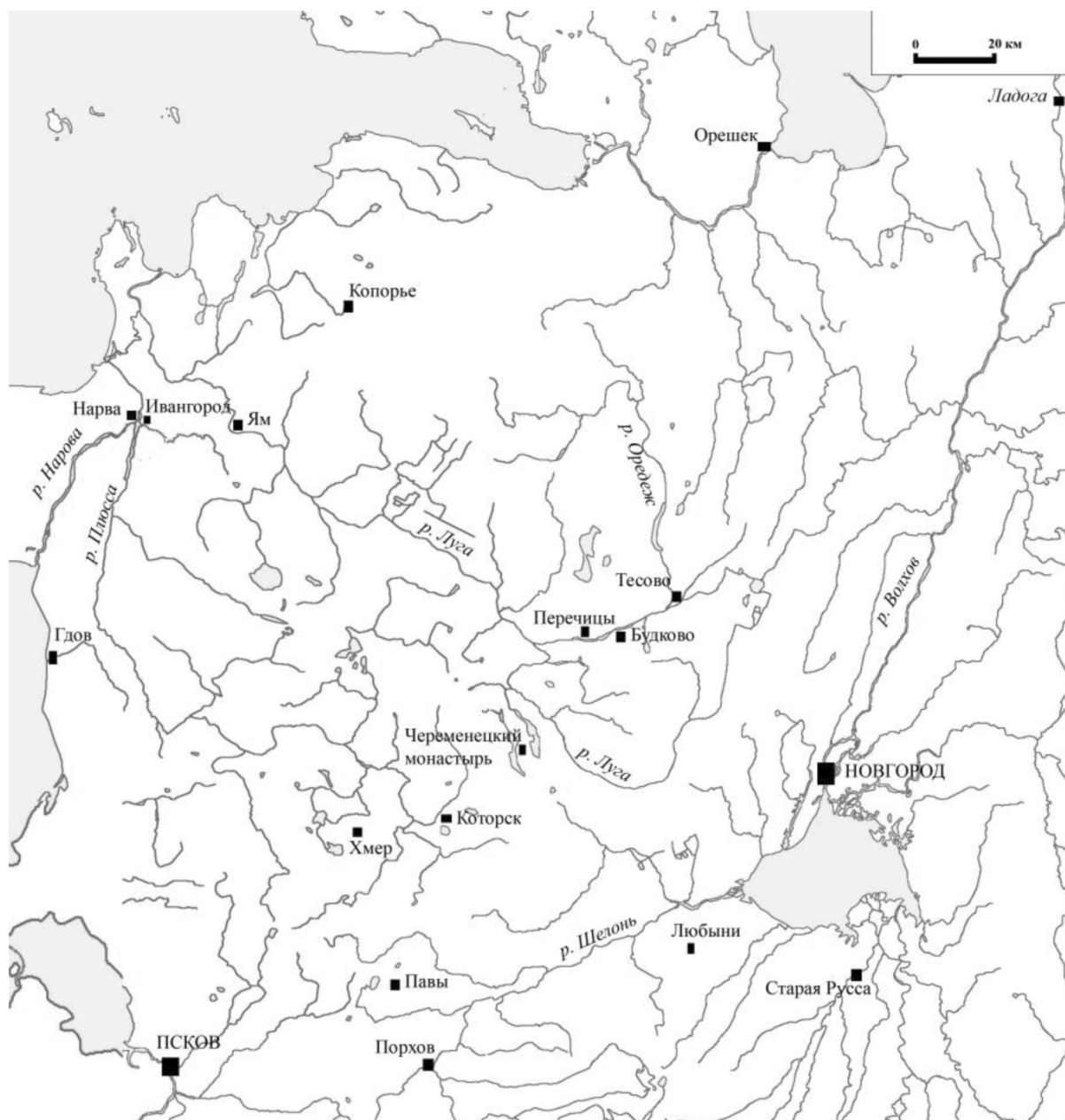
Рис. 1. Местности, связанные с новгородскими Пушкиными в годы Смуты

ния по Шелонской пятине не сохранились; в Водской пятине известно в это время семеро представителей этой фамилии 9 .