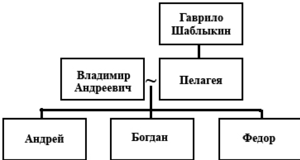
Рис. 4. Схема 3. Генеалогические связи В. А. Пушкина.

ратьевым) 73 воевода И. Н. Салтыков отпустил кормиться, «где хотят». Первоначально они пошли в д. Скреблово, затем к «Богослову», т. е. к Черемнецкому монастырю, там сошлись с «шишами», посланными с псковской стороны грабить и разорять Новгородский уезд. Оттуда дети боярские отошли к Которску, где и были захвачены шведским патрулём 74 . Более сведений о В. А. Пушкине не имеется.