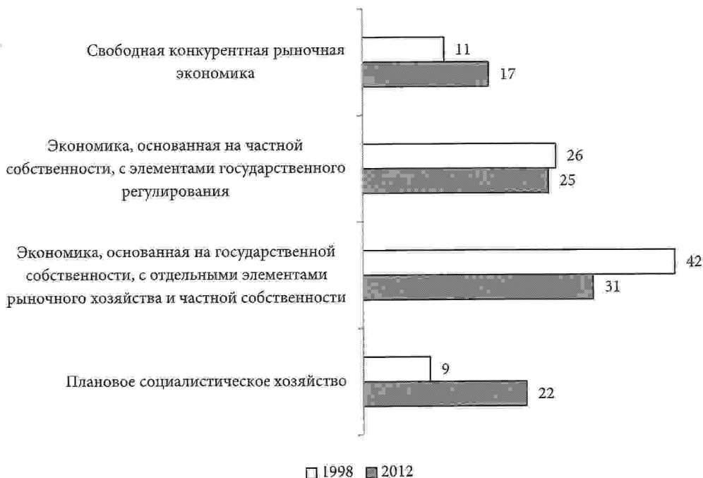
Рис. 2. Каким должен быть, по мнению населения, экономический строй в России, 1998-2012 гг., % (на рисунке не указаны затруднившиеся с ответом)

рыночной экономики и сторонников плановой экономики социалистического типа (см. рис. 2). Таким образом, и в этом отношении можно говорить о нелинейности процесса культурной динамики и поляризации населения страны по представлениям об оптимальном общественном устройстве.