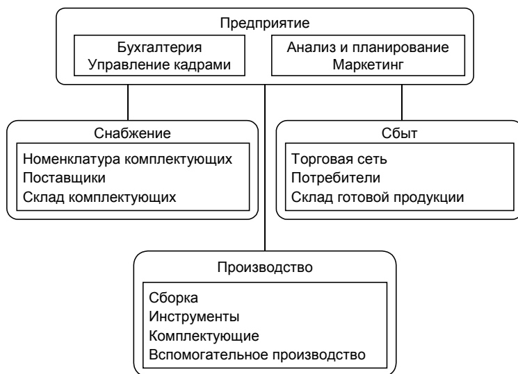
Рис. 1.2. Типовая структура современного предприятия