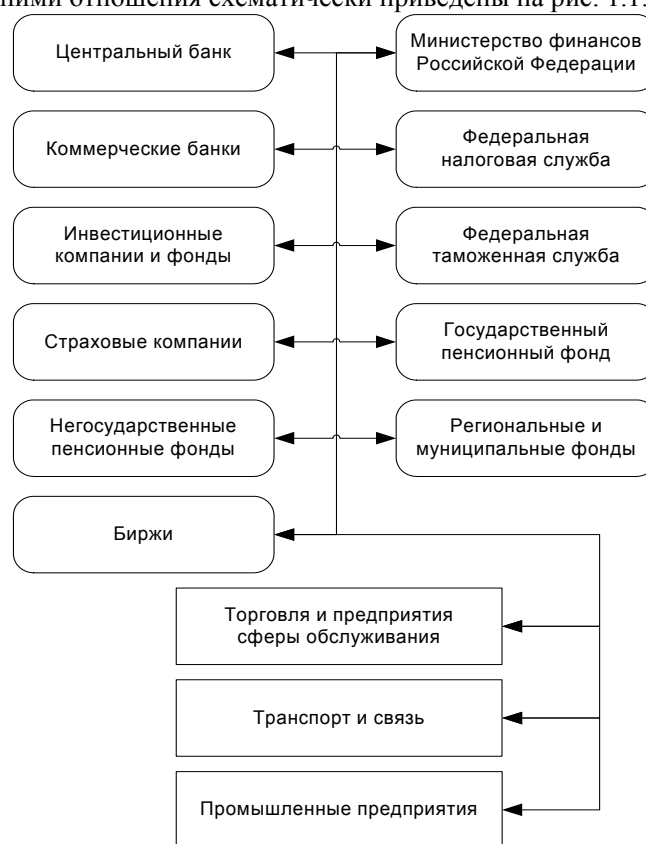
Рис. 1.1. Финансовые потоки и встречные потоки материальных ценностей

Сегодня информационные технологии решают много актуальных производственных и финансовых проблем. Основные субъекты финансовой деятельности, представленные на рынке, и существующие между ними отношения схематически приведены на рис. 1.1.