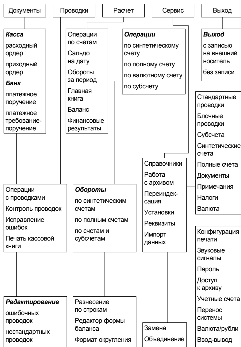
Рис. 1.5. Функциональные возможности типовой бухгалтерской мини-системы

Функциональные возможности типовой бухгалтерской системы включают в себя следующие компоненты.