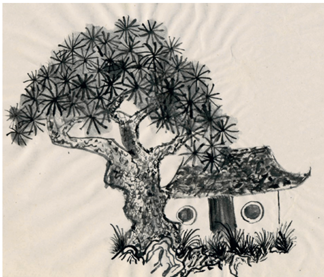
Рис. 3. Родзион. Без названия. Наши дни. Бумага, тушь, акварель. Собрание автора. Сергиев Посад