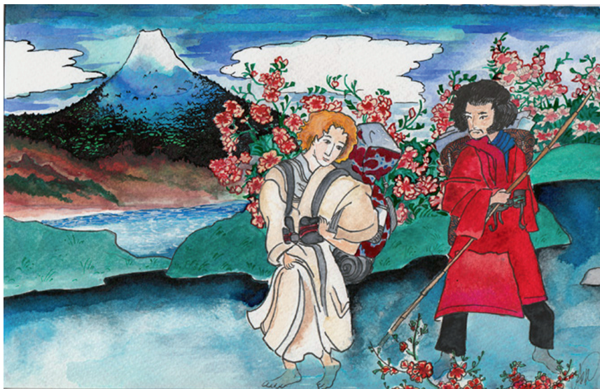
Рис. 2. Аня Глейзер. Заставка к «Узким тропинкам Севера» (по стопам Басё). 2014. Бумага, перо, акварель. Собрание Денниса Славина. Нью-Йорк

В Москве множество японских продуктов питания и ширпотреба можно купить в специализированных магазинах. То есть интерес к Японии не уменьшился, но приобрел более реальные и действенные формы. Рынок спроса ширится, несмотря на невообразимые наценки.