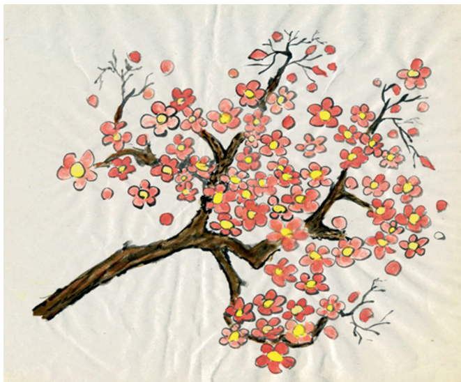
Рис. 4. Родзион. Без названия. Наши дни. Бумага, тушь, акварель. Собрание автора. Сергиев Посад