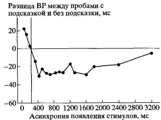
Рис. 2. Выигрыши во времени ответа на верно подсказанные стимулы по сравнению с нейтральным условием в зависимости от интервала между подсказкой и стимулом [14; 899]. Отрицательная область на оси ординат – область торможения возврата.

Согласно данным А. Кастела с коллегами [1], динамика торможения возврата во времени обнаруживает определенную зависимость от возраста испытуемого. В исследовании этих авторов показано, что у испытуемых, чей средний возраст составляет 68 лет, торможение начинается примерно после 500 мс после начала предъявления подсказки, набирает максимальную величину через 1500 мс и постепенно уменьшается, прекращаясь через 3000 мс. У испытуемых, чей средний возраст составляет 21 год, торможение начинается уже через 250 мс после начала предъявления подсказки, быстро достигает своего максимума и достаточно стабильно удерживается примерно до 2500 мс от начала предъявления подсказки, после чего начинается снижение эффекта. Эти результаты свидетельствуют в пользу объяснения ухуд-