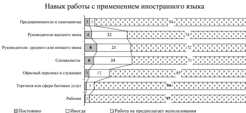
Рис. 4. Навыки, которые представители различных социально-профессиональных групп используют в своей работе, % от работающих их представителей

Вместе с тем сравнение форм пополнения знаний, используемых разными группами работников, позволяет говорить о явном различии причин обновления ими своего человеческого капитала. У руководителей и служащих это связано, как правило, с доведением уже имеющейся квалификации «до ума», в то время как специалисты рассматривают процесс обновления человеческого капитала с точки зрения расширения границ уже имеющейся квалификации [Аникин, 2010а]. Это принципиальное отличие позволяет нам глубже оценить объективные предпосылки модернизации, которые, хотя и существуют, но сосредото-