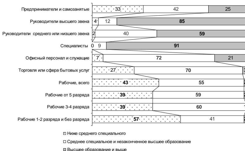
Рис. 1. Специфика образования основных социально-профессиональных групп, % от работающих

Что касается образования, то по этому критерию в российской экономике можно выделить четыре основные точки профессиональной структуры рабочей силы – 1) управленцы , 2) специалисты , 3) так называемый « конторский пролетариат » и рядовые работники торговли и сферы услуг, 4) рабочие . В настоящее время подавляющее большинство управленцев, особенно руководителей высшего звена (85%) и специалистов (91%), обладают хорошими формальными показателями человеческого капитала (имеют законченное высшее образование, см. рис. 1).