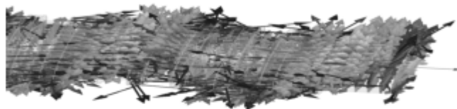
Рис. 2. Распределение электрической составляющей поля вблизи поверхности электрода

Получено распределение электрического поля вблизи поверхности, картина которого имеет периодиче скую структуру (рис. 2). Волна распро- страняется от порта, где осуществляется подача энергии СВЧ, к противо- положному порту без затухания [3].