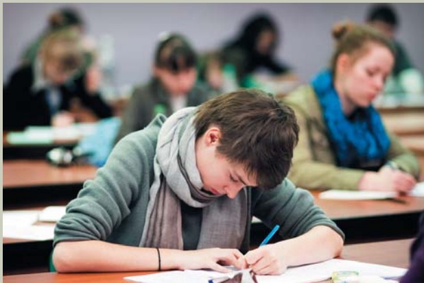
▲ Олимпиадницы за работой

В письме, в частности, говорилось: «В ЦПМК слабо представлены методические школы крупных культурно-образовательных центров России (9 из 10 членов – москвичи), мало представителей таких ведущих вузов страны, как МГУ, СПбГУ, практически нет учителей. Работа ЦПМК в последние годы стала кастовой. Как результат олимпиадные задания однотипны по содержанию и форме, малоинтересны, порой не соответствуют ни возрастным особенностям школьников, ни современным возможностям проведения интеллектуальных состязаний. Немало нареканий и к организации заключительного этапа. Серьезный разбор олимпиадных работ с участниками не проводится, хотя поддержка познавательного интереса ребят к филологии не менее важна, чем определение победителей олимпиады. Отсутствует и активная работа с наставниками