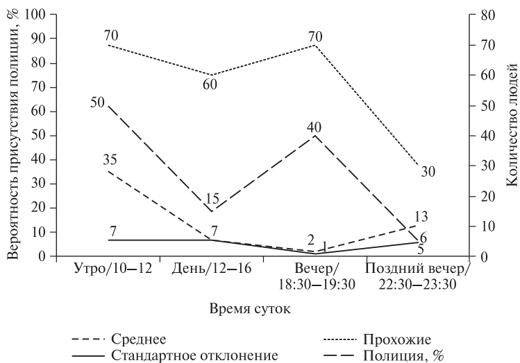
Рис. 6. Режимы пользования рыночной площадью

На базе данных можно сделать следующие заключения, касающиеся наглядных процессов взаимодействия участников на рыночной площади в зависимости от времени суток.