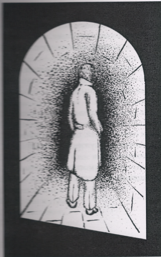
Рисунок Андрея Демьяненко

Помнишь, мы пили коктейль как отвар. Что в нем намешено, знал лишь бармен. Только признаться не смел. Старый бар В мире, не знавшем еще перемен, Был нам отдушиной. Там в пустоте Мы ощущали себя как цари. В плюшевой яме его как нигде Были мы счастливы. Не говори, Что не сбылось ничего из тех снов, Что в том подвальчике виделись нам. Пусть остается основой основ Наша приверженность к крепким парам!