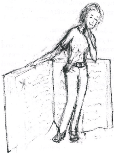
«Менталитет». Рисунок Андрея Демьяненко