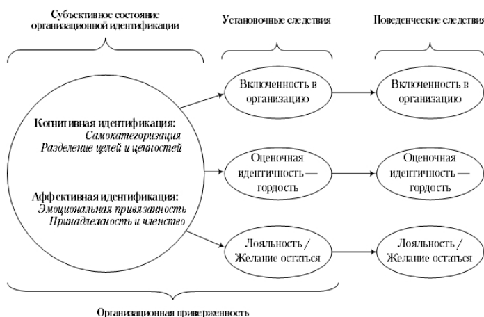
Концептуальная номологическая модель организационной идентификации (Edwards, 2005, p. 220)