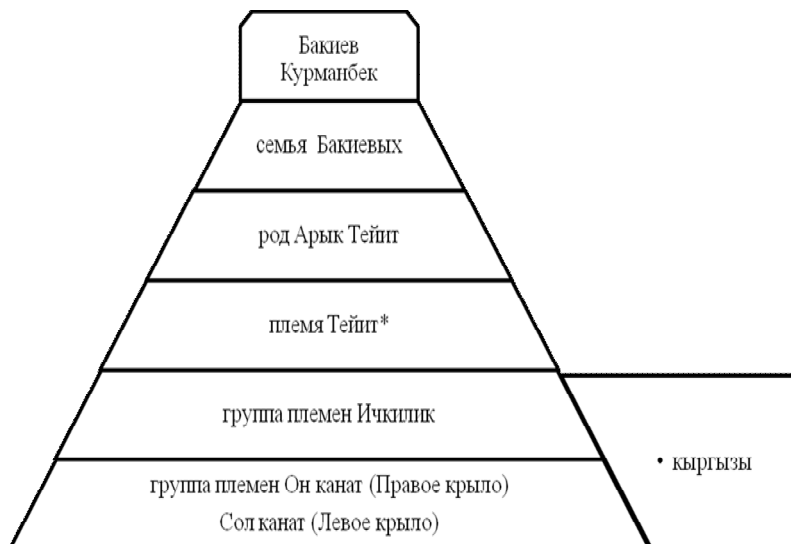
Рисунок 2 Родо-племенная иерархия (по Курбанали Азимову)*