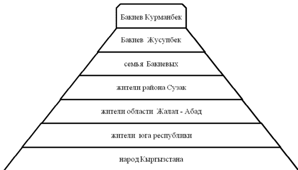
Рисунок 3 Официальная иерархия героев революции*

Чем менее государство становилось демократическим, тем больше возрастало значение К. Бакиева и его семьи. Активное присутствие правящего клана и конструируемая ими революционная память предполагала усилить символические основы настоящего, в которой не только президент, но также и его окружение имело бы доступ к ограниченным ресурсам. Интерпретационные усилия узаконили порядок, в котором de facto они занимали высшую позицию над Конституцией, над ветвями власти, а иногда даже над чужой частной собственностью (например, через рейдерство). Притеснялась оппозиция и поддерживающая их символическая элита, ограничивалась свобода слова и печати. Одновременно поощрялась поддержка официально создаваемой символической действительности. Таким способом власть устанавливала иерархию важных и неважных деяний, обозначая то, что мы должны помнить, а что предать забвению. Все указанные