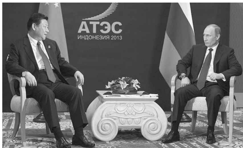
Председатель КНР Си Цзиньпин и В.В.Путин чувствовали себя комфортно на форуме АТЭС-2013 на о. Бали.

пертов, существуют как обстоятельства, способствующие эскалации конфликта, так и факторы, предотвращающие развитие крупномасштабной конфронтации.