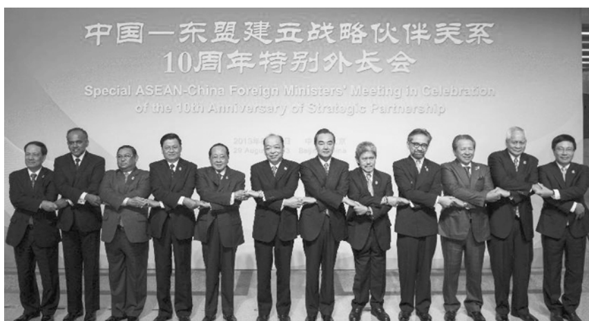
Министр иностранных дел КНР Ван И на встрече со своими коллегами из АСЕАН призвал к добрососедству в Южно-Китайском море...

укреплять союзнические отношения с Японией, Южной Кореей, Австралией, Филиппинами, Таиландом, но и налаживает сотрудничество в сфере безопасности с Индонезией, Малайзией, Брунеем, Сингапуром, Вьетнамом. Последние не являются союзниками США, однако по имеющимся соглашениям американцы имеют доступ к их портам, военным полигонам, ремонтным базам, что значительно укрепляет их военное присутствие в ЮВА.