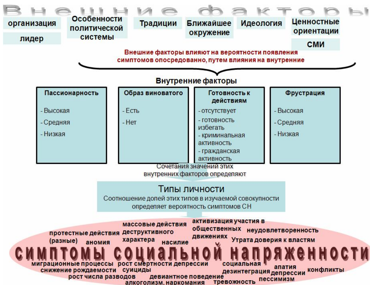
Рис. 2 Модель связи внутренних и внешних факторов и симптомов СН.

На рис. 2 приведена концептуальная схема социальной напряженности, в которой отражена модель связи уже перечисленных внутренних и внешних факторов и симптомов социальной напряженности.