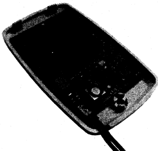
Рис. 4. Носимое измерительное устройство

Носимое измерительное устройство такой системы (рис. 4) представляет собой комбинацию модуля беспроводной сенсорной сети и инерциального датчика. Инерциальный датчик включает в себя: датчик угловой скорости, датчик ускорения, датчик магнитного поля.