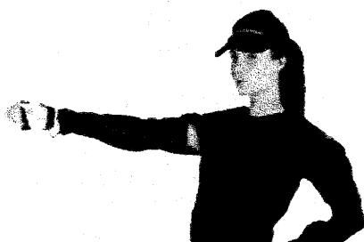
Рис. 2. Система захвата движения Animazoo IGS-180, UK

Недостатками таких систем являются: высокая стоимость отдельных измерительных устройств и всего комплекта в целом.