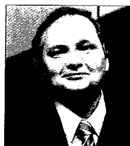
Замдекана факультета мировой экономики и мировой политики ГУ-ВШЭ

Россия с трудом вписывается в мировую экономику и мировую политику, наши преимущества зачастую перечеркиваются нашими недостатками.