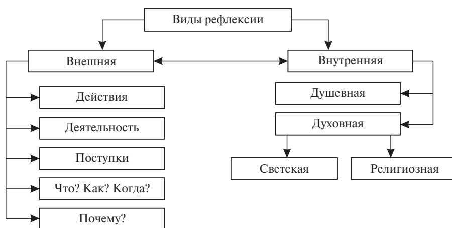
Рис. 2. Виды рефлексии (предмет рефлексии)

Сказанное выше можно представить на рис. 2.