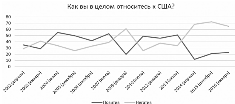
Рисунок 4 Отношение россиян к США