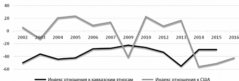
Рисунок 5 Динамика отношения россиян к кавказским этносам и к США