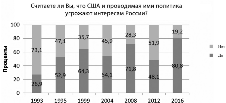
Рисунок 1 Восприятие российской элитой США как угрозы