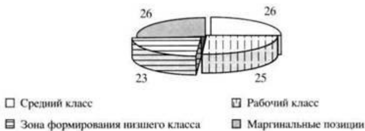
Рис. 1. Типы социальных позиций, занимаемых экономически активным населением России (%) 6

вых позиций практически трех четвертей экономически активного населения страны говорит о применимости классовой модели анализа социальной структуры и в современной России.