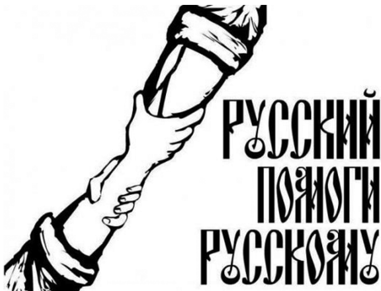
Рис. 10. Плакат на стене сообщества «Русские пробежки. Русские за ЗОЖ. Русь!», 30 сентября 2012 г. 1

На фоне эффективной организации посредством Интернета в 2012 г. особенно заметно снижение организационной активности в социальных сетях в среде «массового» национализма в 2014 году. Если в 2012 г. 31 % всех сообщений в исследуемых сообществах были посвящены организации мероприятий и призывам к самоорганизации, то в 2014 г. этот показатель снизился до 23 %, причем снижение было выявлено во всех трех сообществах. Обсуждение событий в Украине на волне «Русской весны» поглотило организационную часть контента националистических сообществ ВК — впрочем, так же, как и популярную двумя годами ранее «кавказскую» тему.