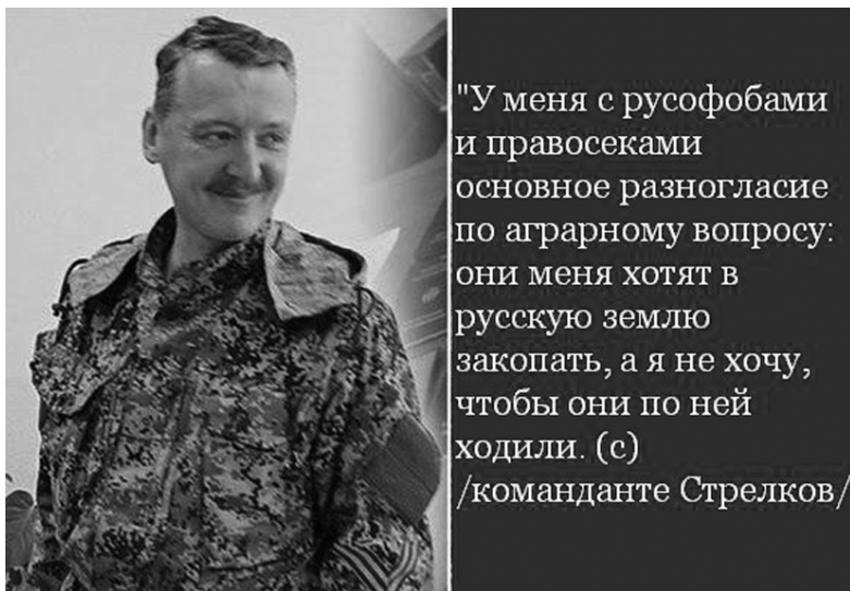
Рис. 9. Из сообщества «Я русский», 24 мая 2014 г. 1

Эти симпатии принципиально отличали дискурс националистических сообществ в Интернете от государственной пропаганды «Русской весны» по телевидению, где центральное значение придавалось мирному русскоязычному населению Украины, страдающему от действий собственной армии. Для «массового» националиста события на юго-востоке Украины стали свидетельством подъема русского национального самосознания.