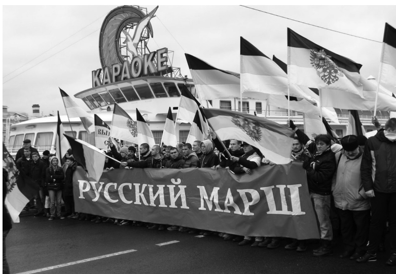
Рис. 7. Из сообщества «Я русский», 21 октября 2013 г. 1

Глава посвящена интернет-образу российского националистического движения. В ней описывается круг современных трактовок национализма и неразрывно связанного с ним понятия нации, а также предлагается общая характеристика русского националистического течения в исторической ретроспективе. Затем на основе эмпирических интернет-данных анализируется российский националистический дискурс в 2012 и 2014 гг. Анализ позволил заключить, что русскому национализму, несмотря на новые теоретические и практические нововведения в доктрину, так и не удастся изжить свой имперский характер.