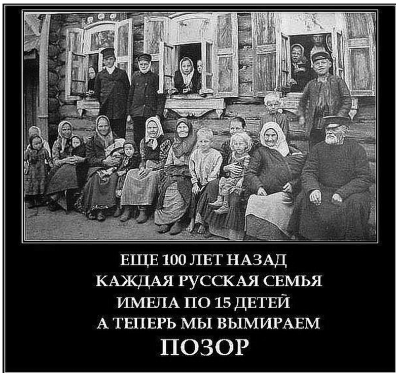
Рис. 12. Из сообщества «Русские пробежки. Русские за ЗОЖ. Русь!», 24 сентября 2012 г. 1

При этом в «Русских пробежках» редко публикуются идеологически насыщенные тексты, в основном — изображения с позитивным или негативным содержанием (рис. 12 и 13).