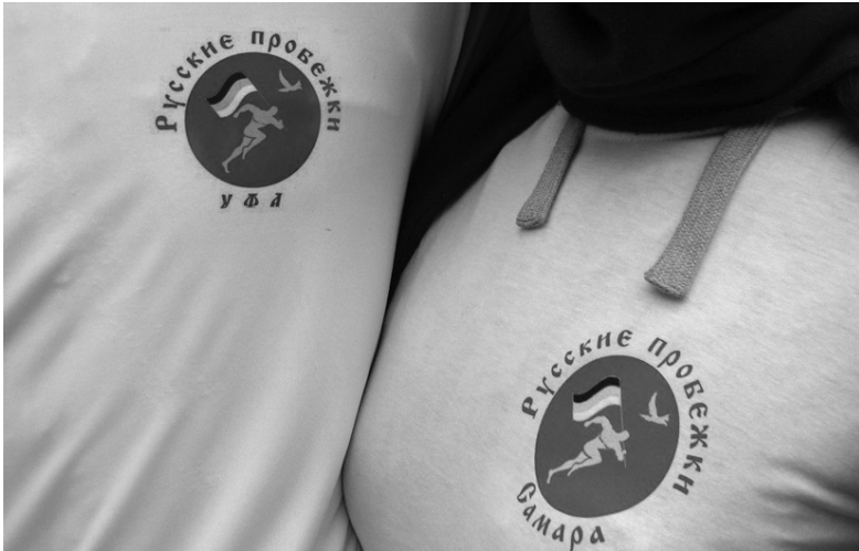
Рис. 11. Из сообщества «Русские пробежки. Русские за ЗОЖ. Русь!», 20 мая 2014 г. 1

Встречаются и экстравагантные темы: например, лозунг «Русские против блондорасизма», под которым подразумевается борьба со стереотипом о глупых блондинках. Видное место среди гендерно окрашенного контента ЗОЖ-сообществ занимает пропаганда против связей русских женщин с представителями нерусских народов — преимущественно выходцами из Средней Азии и с Кавказа. Широкое распространение получило унижительное прозвище «чернильница», обращенное к русским женщинам, вступающим в близкие отношения с мужчинами, происходящими из этих регионов.