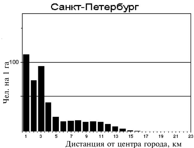
Рис. 2. Графики распределения жителей. Моноцентрический город (Санкт-Петербург)

Источник. Fujita M., Krugman P., Venables J. The Spatial Economy. Cities, Regions, and International Trade The MIT Press, 1999. С. 21.