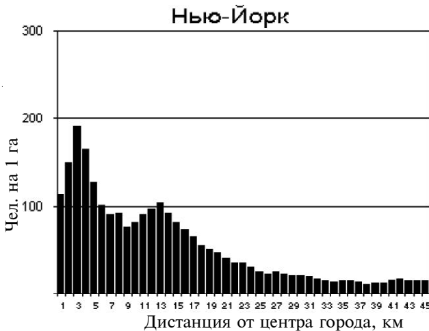
Рис. 1. Графики распределения жителей. Полицентрический город (Нью-Йорк)

Какое отношение полицентричность имеет к исследованию расположения общественных благ? В случае, если бы отсутствовала необходимость в общественных благах, то дополнительные бизнес-центры создавались бы агентами самостоятельно 10 , однако в реальности требуется вмешательство планирующего агента. Первоначально создание второго (и последующих) делового центра возможно только при поддержке планирующего агента. Так, создание дополнительного делового центра уменьшит издержки (изменит форму кривой C(P) , сделав ее более поло-