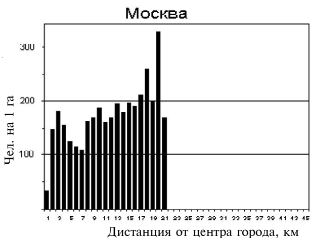
Рис. 3. Графики распределения жителей. “Особенный” город (Москва)

Модель линейного города, введенная в употребление Хотеллингом, является наиболее изученным в теории случаем. Из ряда работ этого направления необходимо выделить работу, содержащую доказательство, имеющее очень важное практическое значение 14 . Так, для случая дискретно расселенных жителей на территории линейного города доказано существование такого распределения объектов общественных благ, при котором потребители будут достигать одинакового уровня полезности с учетом транспортных издержек. Более того, оптимальное распределение объектов с различной мощностью предоставления благ будет доминировать по Парето над распределением объектов с одинаковой мощностью.