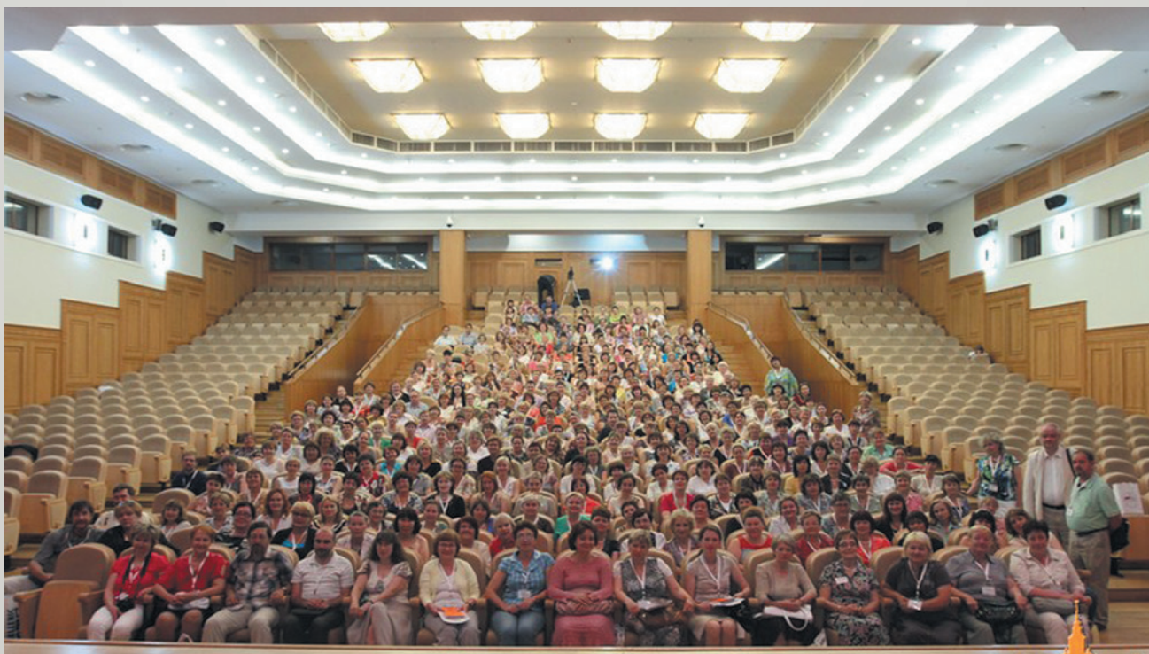
▲ Участники съезда.

Подробную информацию о прошедшем съезде можно найти на сайте http://philol.teacher.msu.ru/