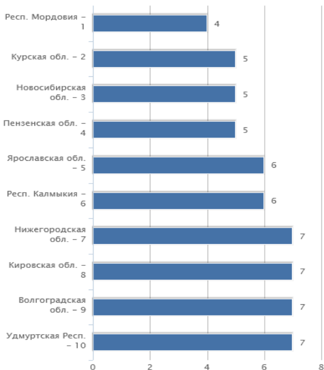
Рис. 1. Процент согласившихся с утверждением «Я хотел(-а) бы иметь много детей» [3]